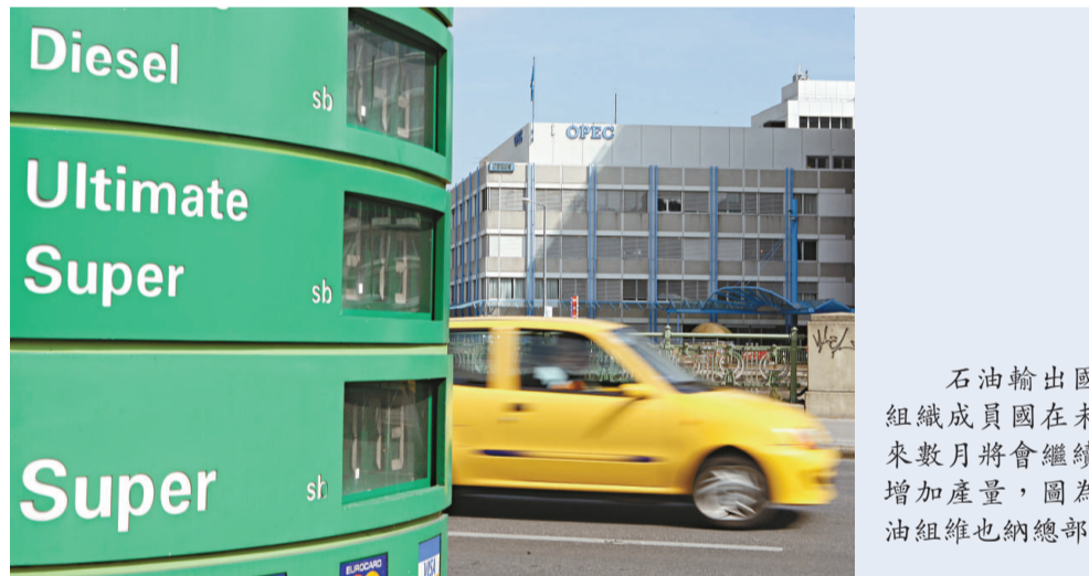
石油輸出國組織成員國在未來數月將會繼續增加產量，圖為油組維也納總部

期油的淨長倉合約，即期油買賣合約差額，在截至一月十二日的當周大升了兩成半，至破紀錄的135669份，反映出炒家對油價未來甚為看好。