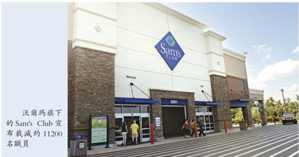
沃爾瑪旗下的Sam's Club宣布裁減約11200名職員

截至去年10月31日止季度，Sam's Club營業額跌0.7%至116億美元，表現不如沃爾瑪的海外銷售部門的1.6%增幅，亦不及沃爾瑪美國本土分店的1.2%增幅。業界分析指出，Sam's Club表現落後同業。Sam's Club現時約有11萬名員工，裁員計劃之下，每間分店約裁減兩個職位。沃爾瑪在1月11日宣布關閉10間Sam's Club分店，裁員約1500人。沃爾瑪股價1月22日升2美仙，報每股52.94美元，股價去年跌4.7%，跑輸標普500指數的24%升幅。