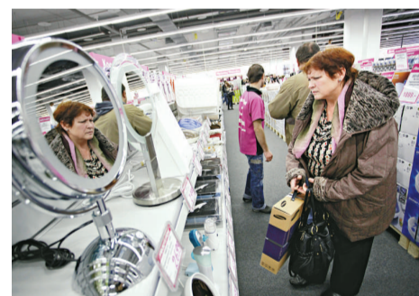
金磚四國於全球扮演更為中心角色，乃無容置疑的事實，圖為俄羅斯市場

新興市場國家經濟發展過程中，如何處理環境保護與社會貧富問題，實為重大挑戰。《金融時報》撰稿員的想法，正好代表西方對