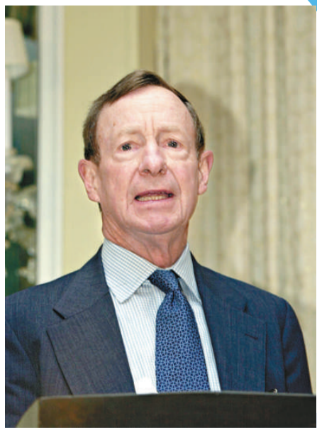
碧斯表示，全球經濟正在加速增長

事實上，末日言論並非空穴來風。上週大摩指數下跌了3.8%，為自去年十月以來的最大跌幅。美國總統奧巴馬要求限制金融機構的合作規模以及交易活動，中國