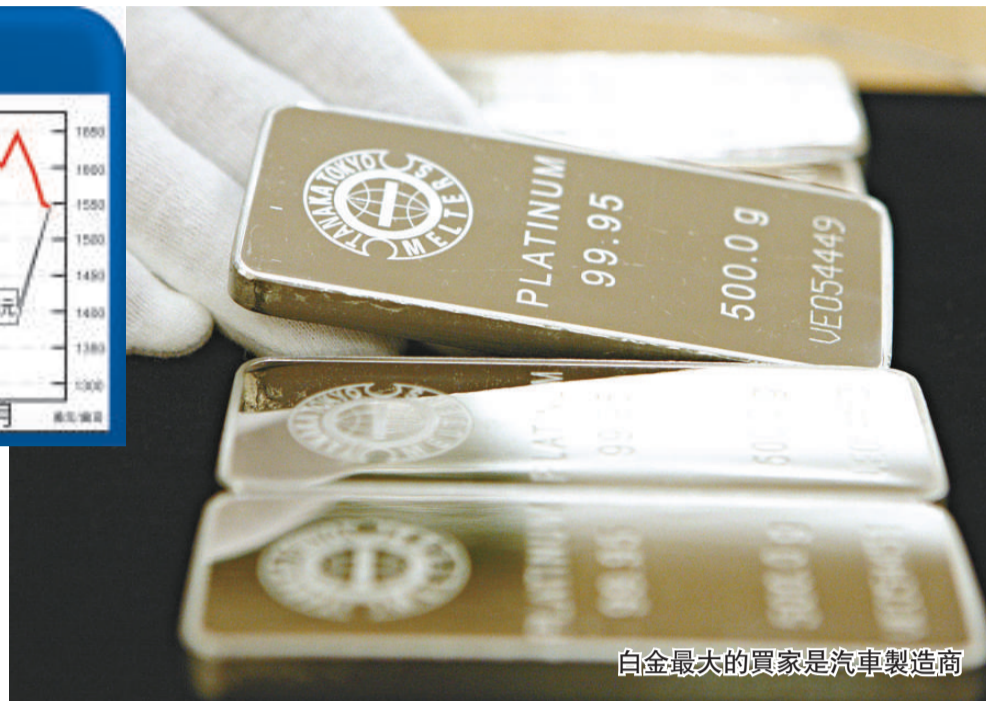
白金最大的買家是汽車製造商

生產商Anglo Platinum和Impala Platinum Holdings的股價延續升勢，Anglo Platinum的股價在昨日一度回升至819南非蘭特的十五個月高位，在昨日一度回軟至759.43蘭特。事實上，全球八成的白金供應量是來自南非，當地白金礦會因為電力供應不足而在2008年一度大量關閉。隨着今年六月和七月南非將舉行世界盃賽事，相信屆時的電力供應會再度變得緊張，業內人士相信，今年白金的產量會再次因為電力供應的問題而再度大跌。