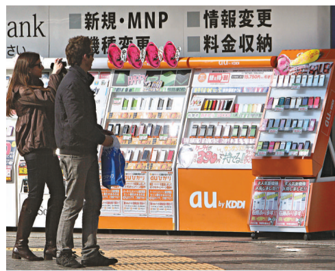
日本第二大手機經營商KDDI進軍日本有線電視市場

日本第二大手機經營商KDDI宣布，作價40億美元(3620億日圓)，收購日本有線電視經營商Jupiter Telecommunications的38%股權。KDDI同意由Liberty Global買入259萬股Jupiter Telecommunication股票，以KDDI周一收市價計算，該宗交易溢價達44%。該宗交易是KDDI最大投資，收購Jupiter之後，KDDI日本在新增客戶約330萬，減少對NTT的光纖依賴。但分析員表示，如果僅看收購價錢對KDDI並不有利，似乎略為昂貴。截至2008年12月底，Jupiter盈利279億美元，銷售為2943億日圓。消息公布前，KDDI股價在東京市場一度跌2%，收報每股528000日圓，不過當交易正式公布之後，Jupiter股價急升15%收報每股97000日圓。