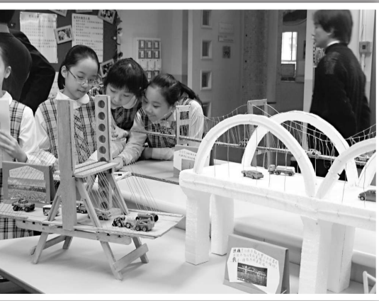
製作了幻燈片和橋樑模型，表達行程收穫及感想

首次主題為「文化古城尋根之旅」，逾二百所學校的三千五百名高中生，將於本月三十日至下月四日，到內地六大古城包括北京、天津、上海、南京、西安及鄭州參訪。學生首先前往北京，期間將會見國家領導人，之後會分批到訪各大城市作深入文化考察，進行外交講座及文娛活動。