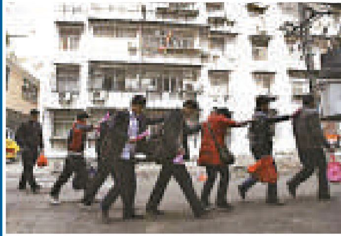
警方在「冬季行動」中抓獲多名傳銷人員