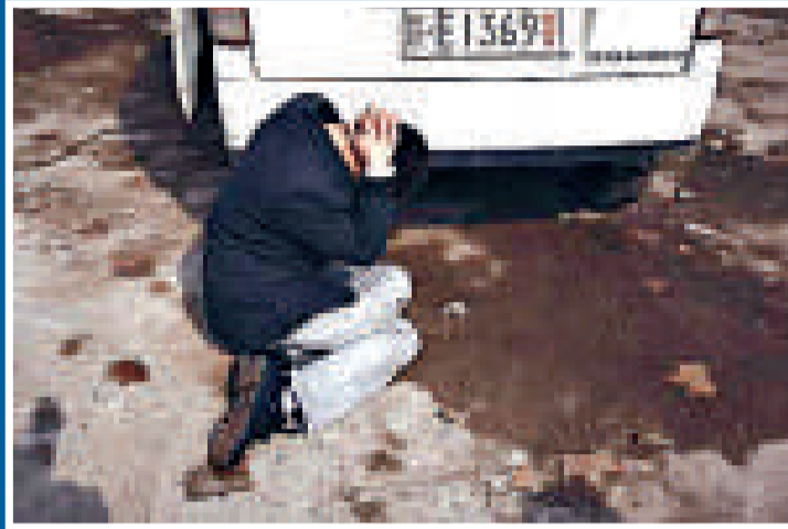
涉案被捕的上饒市非法傳銷組織骨幹要員

【本報訊】去年年底，內地著名作家慕容雪村潛入江西省上饒市一個大型傳銷窩點26天，在摸清傳銷窩點的一些內幕後，向省公安廳求助，在公安人員的協調下，上饒警方出動大批警力，將涉案的傳銷窩點「一網打盡」，共搗掉23個傳銷窩點，抓獲涉案傳銷人員157人。