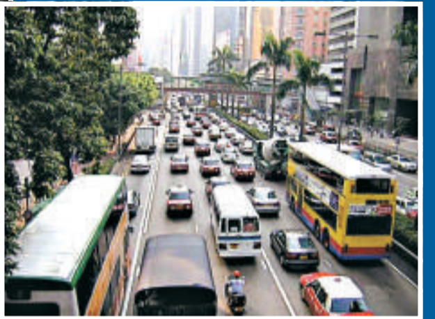
▲繞道可改善中環的塞車情況