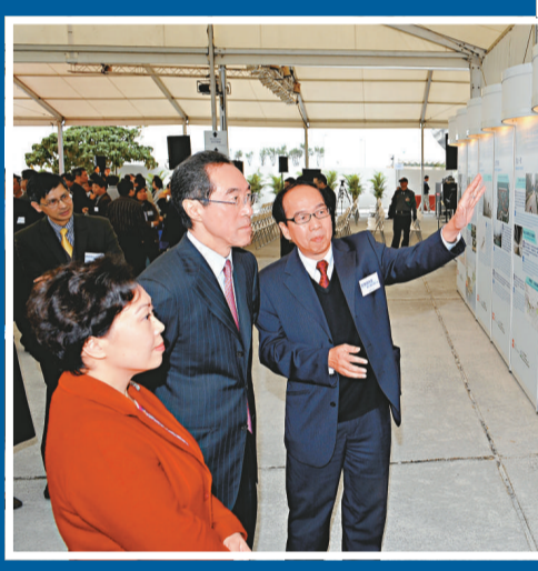
▲唐英年參觀中環灣仔繞道工程的展板

在工程施工期間，為免附近居民受交通噪音滋擾，路政署將於東區走廊近北角路段設立六百米長的隔音屏障及七百三十米長的半密閉式隔音罩。