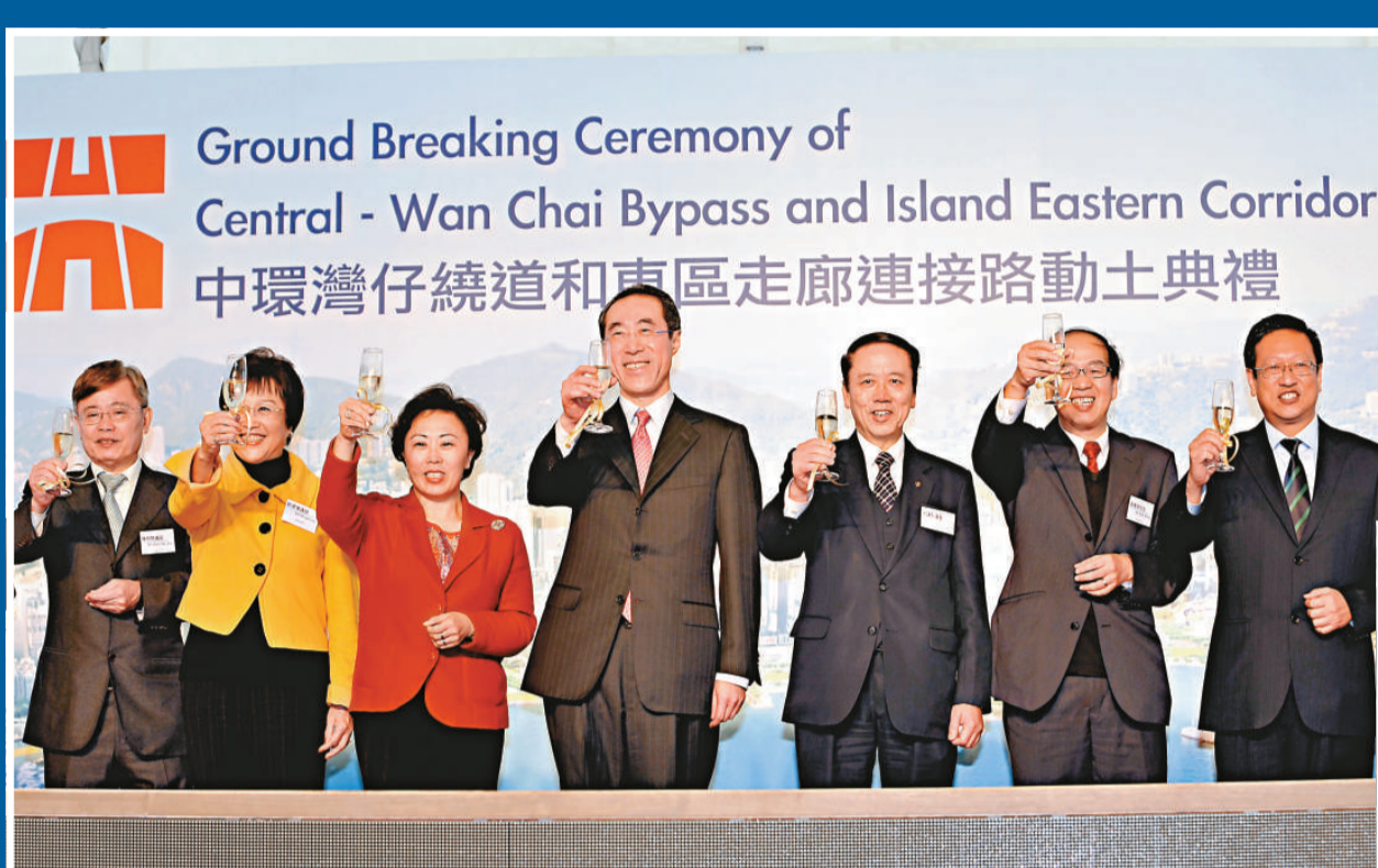
▲唐英年及其他嘉賓在中環灣仔繞道工程動土儀式上祝酒

為興建繞道，位於灣仔海傍的寵物公園需要關閉，不少市民都覺得可惜。唐英年表示，理解市民對寵物公園的需求，政府將與地區人士商討，在區內物色合適地點重設寵物公園。