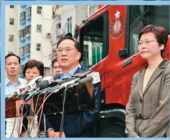
▶曾蔭權(右二)與林鄭月娥(右一)在巡視現場後會見傳媒