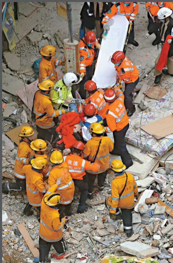
▲慘遭活埋的中年婦被抬出時已奄奄一息