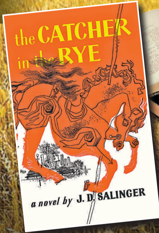
▲世紀鉅著《麥田守望者》是美國叛逆青年的必讀書籍

二〇〇〇年，塞林格的女兒在她的回憶錄中描繪了作家那段不快樂的隱居生活：他會喝自己的尿，說別人無法聽得懂的話。但該書的內容卻遭到塞林格的兒子馬特質疑，並認爲它的內容真實性低。