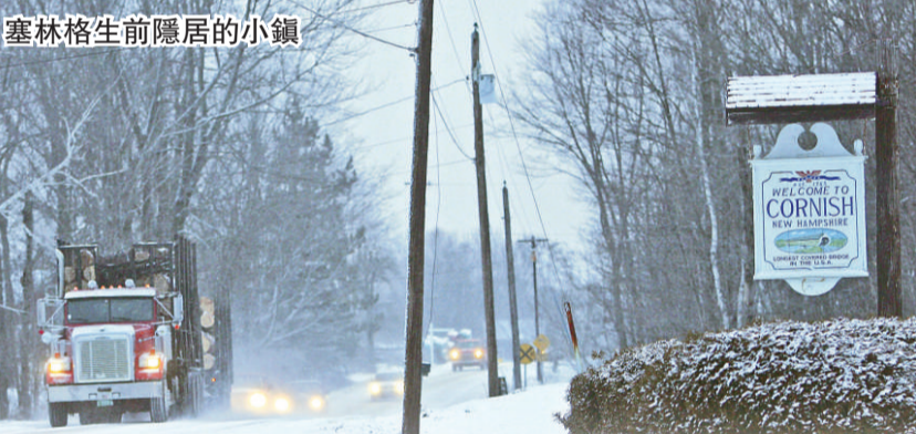
塞林格生前隱居的小鎮

二〇〇九年六月，塞林格的律師向紐約曼哈頓聯邦法院提交了訴訟文件，要求強制回收即將於秋季在美國問世、瑞典作家爲其續寫的小說《六十年之後：穿越麥田》，最後美國法官勒令該續集不准在美國出版。(綜合報導)