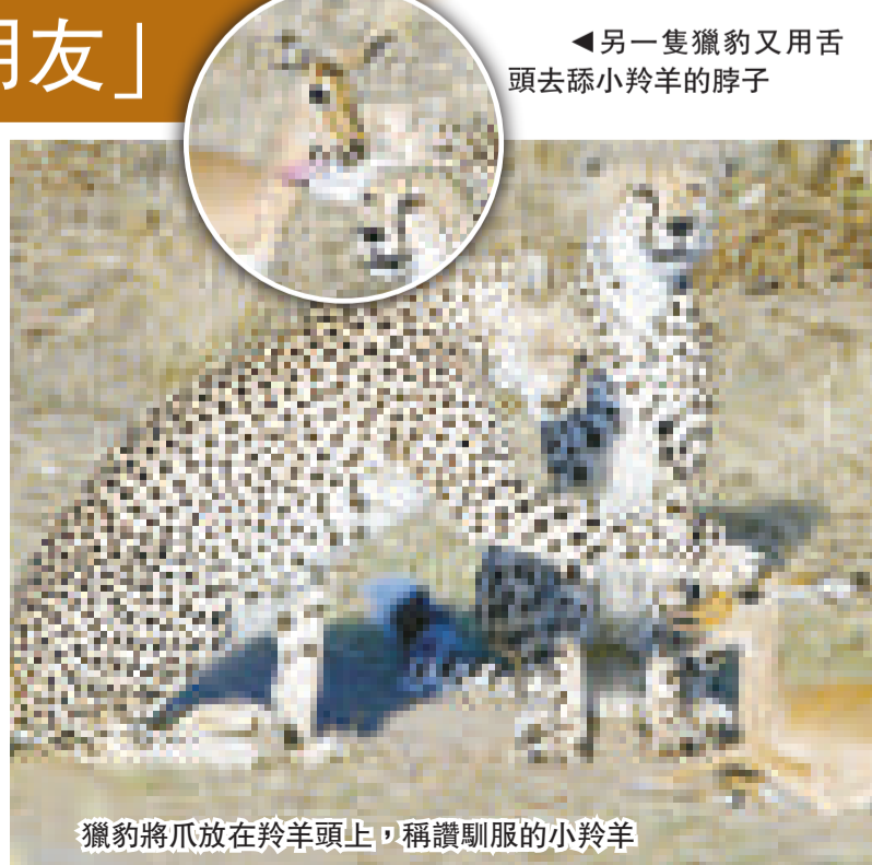
獵豹將爪放在羚羊頭上，稱馴服的小羚羊