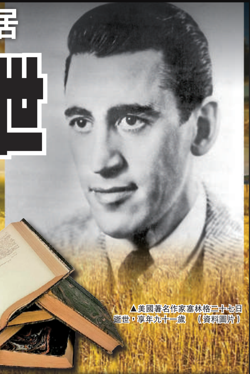
▲美國著名作家塞林格二十七日逝世，享年九十一歲 (資料圖片)

【本報訊】綜合通訊社二十九日消息：被譽為二十世紀最偉大的作家之一、以小說《麥田守望者》留名於世的美國作家塞林格二十七日去世，享年九十一歲。《麥田守望者》是美國叛逆青年的必讀書籍，約翰連儂的暗殺者也是受《麥田守望者》「啓發」而行兇。雖然《麥田守望者》震驚和啓發了世界，但塞林格卻不要名氣，隱居了半個世紀。