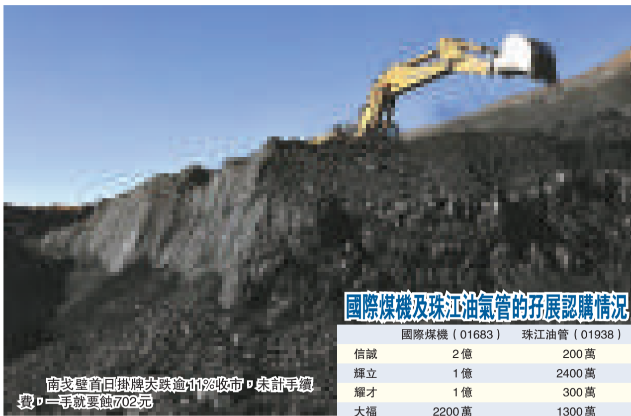
南戈壁首日掛牌大跌逾11%收市，未計手續費，一手就要蝕702元

新股上市表現受重創，大大影響投資者認購新股的信心，綜合券商數量，於昨日進行第二日招股的珠江油氣管（01938），只錄得約5400萬元的孖展額，以該股公開發售集資1.845億元計，目前仍未足額，至於獲市場看好的國際煤機（01683）昨日亦首日登場招股，首日孖展認購反應一般，僅獲得足額認購。