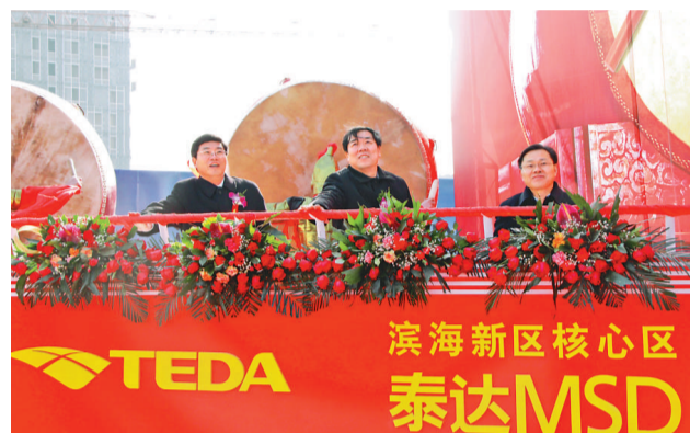
天津市委副書記、濱海新區區委書記何立峰（中）出席泰達MSD項目封頂儀式

根據規劃，泰達MSD項目包括天津濱海新區約20多棟商廈，總建築面積約134萬平方米，分為核心區和拓展區兩部分。核心區內的國際甲級寫字樓及商業，將堅持只租不售、長期持有的運營策略；拓展區的甲級寫字樓及商業，部分可定制或定向銷售。