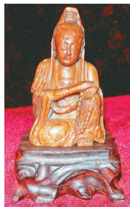
迎春文玩書畫保真展銷會藏品之一

新年伊始，為了活躍市民的節日生活，促進收藏界交流，抵制贗品衝擊，提高廣大收藏愛好者的情緒和信心，深圳市文物藝術品收藏協會在深圳市航誠藝都中國工藝精品商場二樓隆重推出了別開生面的迎春會員文玩書畫保真展銷會，時間將持續三個月。廣大收藏愛好者可以在春節前後去盡情觀賞、淘寶、交流。