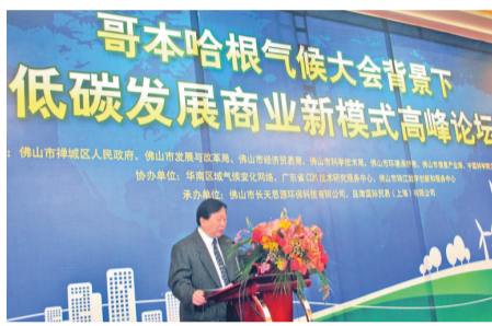
「低發展商業新模」高峰论坛在佛山舉行