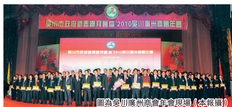
圖為吳川廣州商會年會現場

吳川廣州商會的會員與外地各地工作經商的吳川人，發揚艱苦拚搏、創業興家、與時俱進精神，不但搞活經濟、創造財富，而且更熱衷公益事業，積極回報社會，熱心為家鄉建設捐資出力。吳川廣州商會自2002年正式建會以來，為賑災、扶貧助學、救死扶傷等各種公益慈善活動捐款金額達2400多萬元。會員積極為家鄉文化村建設建橋、修路以及各種公益事業捐贈達2億多元。商會以及會員個人自發性的善舉，在社會上產生極大反響，贏得了社會的廣泛讚譽。