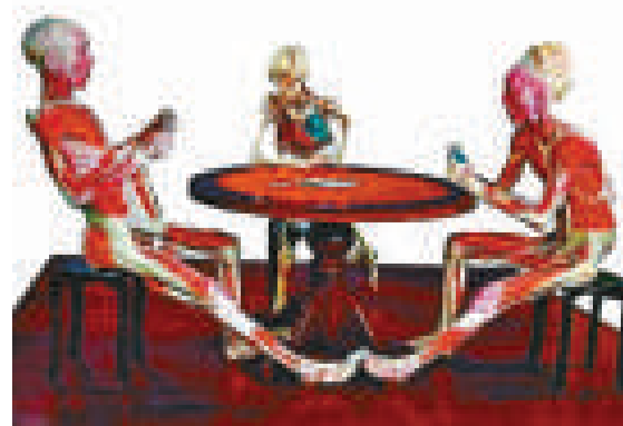
▲德國將從二月五日起展出「打撲克的屍體」

二月五日起，他將在德國不萊梅城市展出「打撲克的屍體」展，此次展覽的屍體將超過二百具。一名女發言人稱，此次展出的最大特色是三具在圓桌邊上打撲克的屍體，並且是在公共場合下進行的首次展出，因此必將受到極大關注。