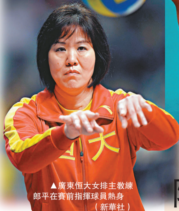
▲廣東恆大女排主教練郎平在賽前指揮球員熱身

恆大女排昨晚與美國女排的比賽，爲中國排球俱樂部的發展開創了一個新的模式，通過與國際強隊的對抗比賽，提升自己的技戰術水平，推動中國排球運動的發展，營造更好的排球市場氛圍，意義重大。而且這種由恆大排球俱樂部開創的國際對抗模式，相信僅僅是個開始。