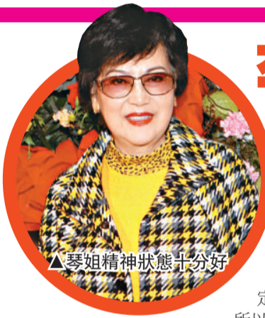
▲琴姐精神狀態十分好

與寰宇尚有幾年合約，她相信解約後大家會有更好的合作對象，相信分開會更好。今次與老闆林小明也是在和平氣氛下談解約的，之後她未有打算簽新公司，她不想被合約束縛，希望以自由身接工作。問到她是否等嫁？她笑言也是等上天安排，但現在結婚太早了，希望二十八歲才嫁人，現在尚有兩年時間。