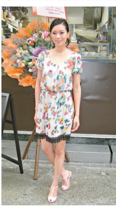
▲田亮與一名年輕女子共進午餐 ▼傳穎對現在的男仔欠缺信心