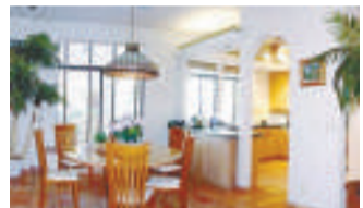
▲▼豪宅有濃厚的西班牙建築風格

美國名人娛樂網站 TMZ 曾將豪宅內櫥曝光。米高曾於二〇〇六至〇七年以一百萬美元租住半年。米高生前最愛的夢幻樂園目前也放盤，開價一千六百五十萬美元。（綜合報道）