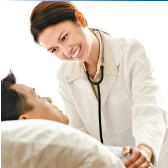
▲腦掃描顯示，有些植物人可以了解別人的話，更可回答簡單提問

一項突破性的科學研究發現，部分植物人儘管表面上沒有意識，但腦掃描顯示，這些植物人不單只可以了解人們的說話，而且可以回答研究人員簡單的提問。當中一名已經重度昏迷了五年的植物人，便透過腦波儀器，和醫生進行簡單的溝通。