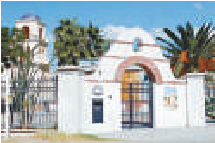
▲米高積遜住過的豪宅正門