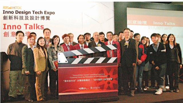
▲HKDI與政府青少年網站 Youth.gov.hk 合辦青年首作坊計劃

今次發表的創作題材多元化，其中有HKDI學生走訪面臨臨遷拆的觀塘裕民坊居民的感受。修讀與電影相關高級文憑的學生就