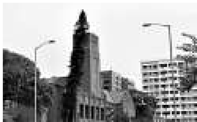
▲瑪利諾修院學校昨決定，移除俗稱「鬼樹」的異葉南洋杉

發展局發言人表示，一直重視保育樹木，但在保育樹木同時亦須考慮樹木健康情況、存活機會，以及補救措施的可行性等。局方理解及認同校方移除樹木的決定，應以保障師生和公眾安全為首要考慮，並會協助校方安全地移除杉樹。