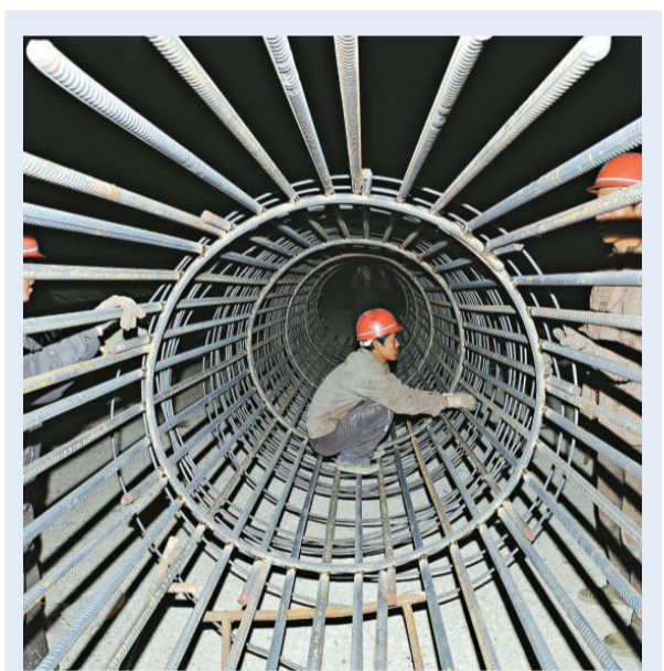
為落實黨中央、國務院提出的「再建一個新北川」精神，山東省二萬名建設工人日夜奮戰在北川新縣城的建設工地上，確保建設順利推進。上圖：五日，工人在北川新縣城緊張施工；下圖：已經封頂的北川新縣城安居工程

通知要求地方各級人民政府要進一步健全應急工作機制，完善應急預案，及時妥善處理因拖欠農民工工資問題引發的群體性事件，堅決防止事態蔓延擴大。對於拖欠時間長、涉及數額大、一時無法解決的拖欠工資，要通過動用應急周轉金等資金渠道先行墊付部分工資，或給予被拖欠工資的農民工必要的生活救助，幫助其解決生活困難。同時，要加強輿論引導，做好疏導工作，引導農民工用理性合法的手段維護自身權益。