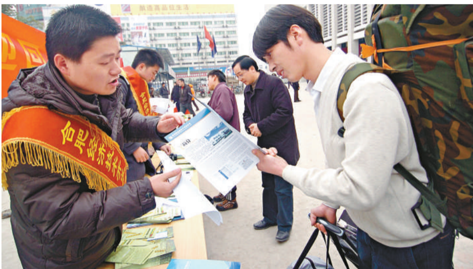
五日，為向春節返鄉的農民工提供就業崗位，合肥市經濟技術開發區勞動部門在合肥火車站出口廣場舉行「送崗位活動」，第一時間將招聘崗位信息送到返鄉農民工身邊

【本報訊】國務院辦公廳5日發出緊急通知，要求各地區、各有關部門和單位加大工作力度，切實解決企業拖欠農民工工資問題。