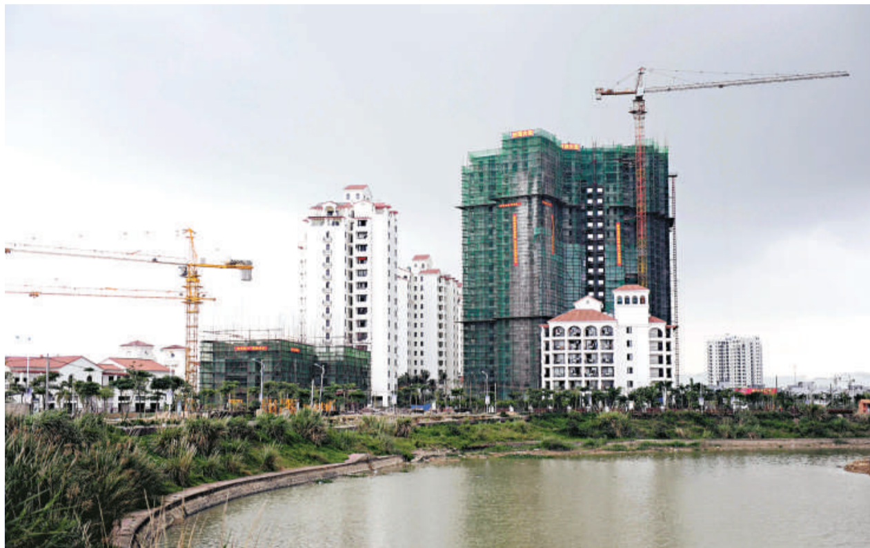
隨着海南省建設「國際旅遊島」目標的提出，省內一些城市的房地產開發火熱起來，海南二線城市瓊海市隨處可見建築工地

記者從海南省住房和城鄉建設廳了解到，2010年，全省房地產開發投資計劃完成330億元，同比增長15%；商品