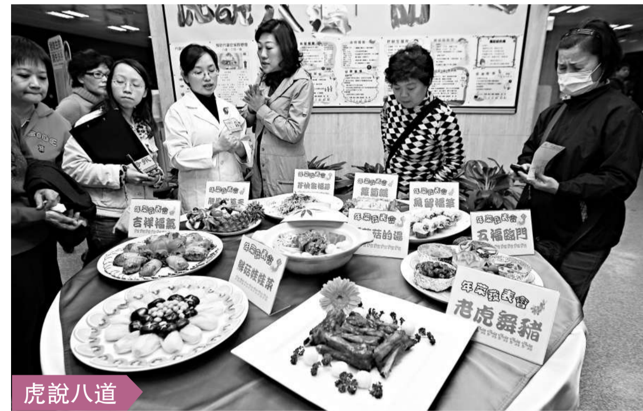
台北國泰醫院五日推出「虎說八道遠離三高」健康年菜，針對圍爐菜色，推廣八種主題的套餐，希望民眾預防代謝症候群，遠離高血壓、高血糖、高血脂。（中央社）

據了解，檢方仍是認為陳水扁犯罪嫌疑重大，仍有重罪及逃亡羈押理由，因此仍有羈押必要。由於合議庭審理陳水扁案，已進入交互詰問階段，檢方評估，如果審理進度順利，陳水扁案最快有可能在今年三月辯論結案。（中央社）