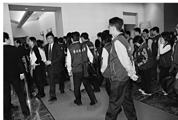
特偵組偵辦二次金改案，五日指揮調查局北機站幹員及檢察事務官，大動作搜索台新金控大樓（中央社）

不過，當初台新金控合併彰銀，立委邱毅及彰銀工會理事長對媒體表示，台新金控標購彰銀可能涉及不法，甚至可能就是施明德所謂「某島內企業給陳水扁二十七億新台幣」的當事人，但是這些指控都遭台新金否認。