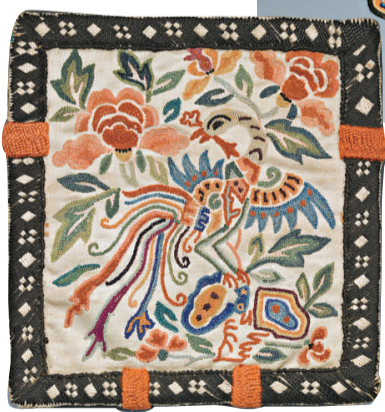
▲雙面彩繡花鳥紋荷包(清代晚期)