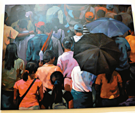
▲作品《Under Midday Sun》 (本報攝)