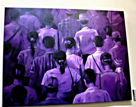
▲作品《Early Morning Ferry》 (本報攝)