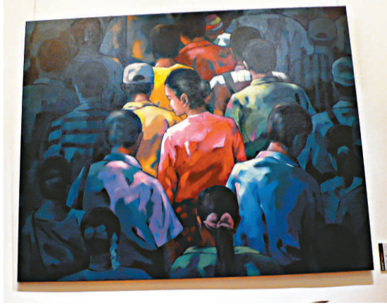
▲作品《A new day》