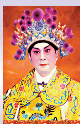
林家聲將親自分享他的演出心得

有興趣的市民可於二月九日(星期二)上午九時起，在香港文化中心和香港大會堂詢問處索取門票，每人限取兩張，先到先得，派完即止。查詢詳情可致電二二六八七三二五，或瀏覽網頁 www.lcsd.gov.hk/cp。