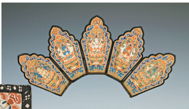
▲刺繡五佛寶冠(十七世紀初)