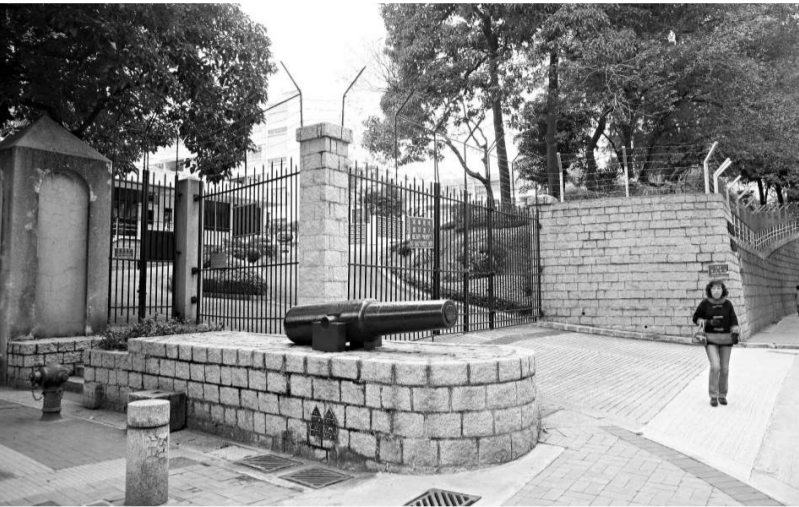
槍會山軍營是尖沙咀唯一尚存的軍事用地

站在彌敦道近佐敦的地方，會發覺西面一帶商店林立，行人如鯽，東面則水靜鵝飛，對比很大。因為東面有大片土地劃為軍營，門禁森嚴，毗鄰又有多少會所設施，閒人莫進。當初政府為何作出如此規劃？這要追溯一八六〇年英國人佔領九龍的歷史了。 英國取得九龍初期，在尖沙咀部署兵力，並將原有的村民遷往油麻地，以劃出海旁地段拍賣。 到一八九〇年，軍方將防線北移，把柯士甸道以北、油麻地彌敦道以東的荒蕪地帶（包括京士柏）列為軍事保留區，設立兩個射擊場，規定區內地段只許興建花園，當時的買家主要来自港島的英籍和葡籍人士，其後容許建屋，便形成了歐式住宅區。 一八九八年租借新界後，軍方的防守線移至深圳河，九龍的軍事地位下降，軍方陸續將土地交還港府發展，只保留威非路兵房（今九龍公園）和槍會山。其後港府重新規劃，把軍事保留區的土地撥給教會和會所使用，現在不少教會學校設於該處，還有一些過去只准外國人入會的會所，包括九龍草地滾球會、九龍木球會、印度會和西洋波會等。 槍會山軍營位於柯士甸道、漆咸道南、加士居道和佐敦里之間，早在一八六〇年英軍已在這山頭駐紮，一九〇二年建造固定營房，部分現今尚存，其後還建學校、教堂和醫院，設施完備。解放軍接收後，駐港部隊醫院亦設於該處。