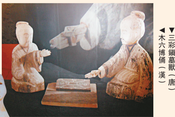
▲三彩鎮墓獸（唐）木六博俑（漢）

「鯤鵬之動——新中國成立六十年甘肅重大文物考古發現展」於甘肅省博物館展出，文物類型多樣，內容豐富，共展出甘肅出土的文物三百三十一件（組），其中很多文物屬首次亮相。展期歷時一年，至今年十二月三十日結束。