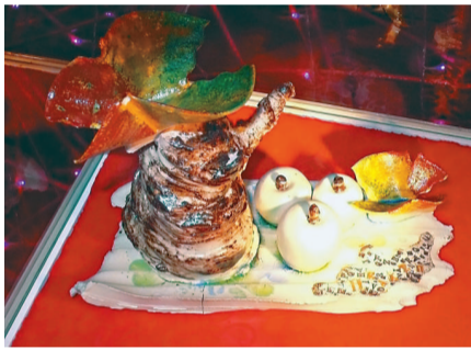
▲這些作品嘗試用石灣陶瓷製法，卻又用上不同釉色，營造特別的卻又用上不同釉色，營造特別的

非我的名氣已建立到，只要我的作品，人們都會購買，否則我暫時還是享受創作的高度自由。」