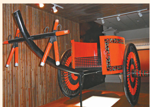
▲張家川馬家塬戰國時期車馬（仿製品）

木六博俑是甘肅省博物館館藏國寶，這組出土於武威磨嘴子漢墓的木器，刻畫了兩個老者全神貫注博奕的場面，惟妙惟肖地表現出對弈時審勢待變的緊張氣氛，堪稱漢代木雕中的藝術精品。