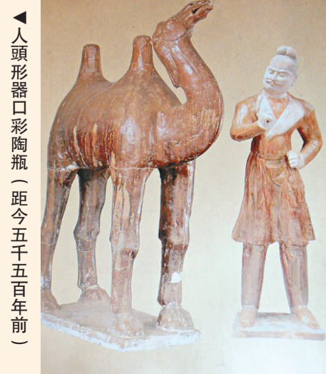
▲人頭形器口彩陶瓶（距今五千五百年前）

甘肅的獨特區域位置和地理自然環境使其在中華文明發展的歷史進程中有重要的地位。絲綢之路、雕塑壁畫、少數民族的遷徙、融合等眾多的歷史遺跡和文物考古發現，使甘肅成為研究我國文明起源進程中東西部差異、西北地區在中國文明起源進程中的作用等，發揮重要作用。