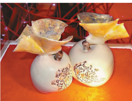
▲兩個相依相偎的蘋果與蝴蝶，上面的文字湊起「LOVE」，一看便聯想起愛情了（本報攝）