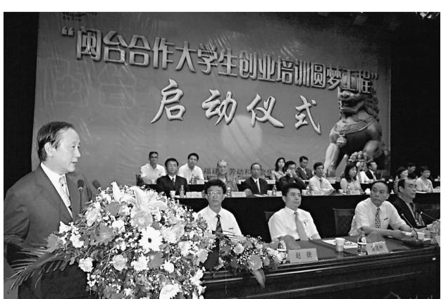
▲閩台合作大學生創業培訓圓夢工程在福建農林大學舉行啓動儀式。圖為新黨主席郁慕明在啓動儀式上致辭

【本報海西新聞中心記者史兵報導】記者剛剛從福建農林大學獲悉：該校有意與台灣中興大學合辦「閩台科技學院」，目前已開始進入聯合籌建階段。而兩校合辦的「福興科技研究院」也已落戶福州，共同開闢閩台教育科研合作的實驗田。台灣中興大學，是台灣歷史最悠久的大學之一，是入選