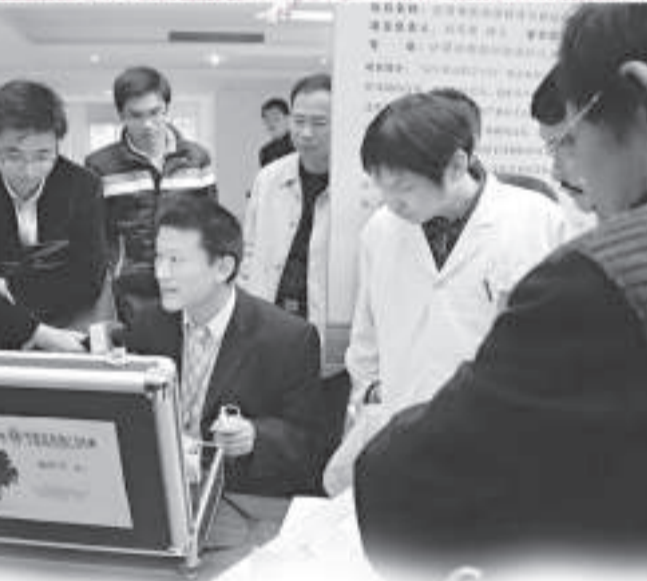
▲去年底，閩省公務員局、中國海峽人才市場聯合舉辦「海外博士海西行」活動。圖為人才與項目對接洽談會上，海外博士與閩省企業對接洽談

據悉，福建農林大學與台灣有著特殊淵源，曾任台灣地區領導人的嚴家淦的胞弟嚴家顯，就曾是福建農林大學的前身——福建農學院的院長。近年來，福建農林大學更成爲兩岸農業教育合作的試驗基地，先後成立了大陸唯一的「海峽兩岸農業技術合作中心」、「海峽兩岸農業交流協會技術交流與信息諮詢工作委員會」、「台灣農民創業園科技服務中心」，初步建成了大陸最大的兩岸農業良種研發基地——台灣名特優植物園，爲兩岸專家加快農業技術合作成果研發和轉化提供了重要平台和載體。去年六月，還啓動了「閩台合作大學生創業培訓圓夢工程」目前已有三千多名大學生接受了培訓；同年十月，全國首批台灣籍函授學歷生在福建農林大學畢業，這批台灣學生於二零零六年考入福建農林大學園藝系函授大專班。