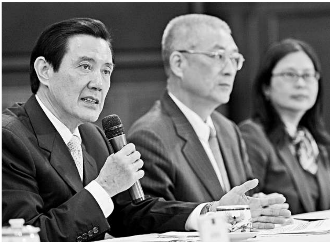
馬英九（左）於九日在「總統府」召開記者會，向民眾解釋簽訂ECFA的理由，並回答媒體提問

對於外界質疑簽ECFA之後可能有陸工來台，及大陸農產品進口的問題，馬英九刻意以台語說明。他指出，陸工來台不是自由貿易協定的問題，而是區域貿易的機制，至於農產品進口部分，從他上任至今並沒有開放一項進口，而他亦不準備開放。馬英九還指出，簽署ECFA也會對台灣競爭力不足的產業有影響，不過，這部分反而也可以透過振興產業，促使產業調整素質，經濟部將決定花十年編列九百五十億元進行救濟的工作。