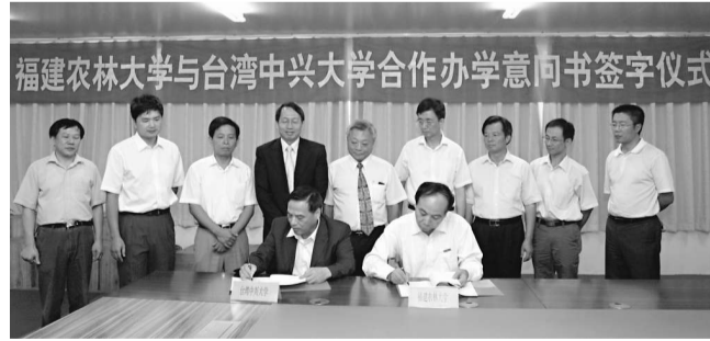
▲福建農林大學與台灣中興大學簽署合作辦學協議書