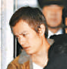
▲松山研一獲贈房車，直言會載女友小雪遊車河，押尾學於月初時申請保釋，但遭裁判所拒絕

因違反麻藥取締法和保護責任者遺棄致死罪而遭起訴的押尾學，於本月三日一度申請保釋外出，但東京地方裁判所於九日表示不受理其申請，意味押尾學將要繼續留在拘留所。押尾學雖然承認曾從朋友處得到搖頭丸，但一直主張自己並沒有犯到遺棄致死罪，對案中的女死者田中香織見死不救，因此申請保釋外出。押尾學去年八月被控使用搖頭丸時，一度成功保釋外出，但由於今次起訴涉及人命，嚴重性有所不同，所以其申請不獲受理。