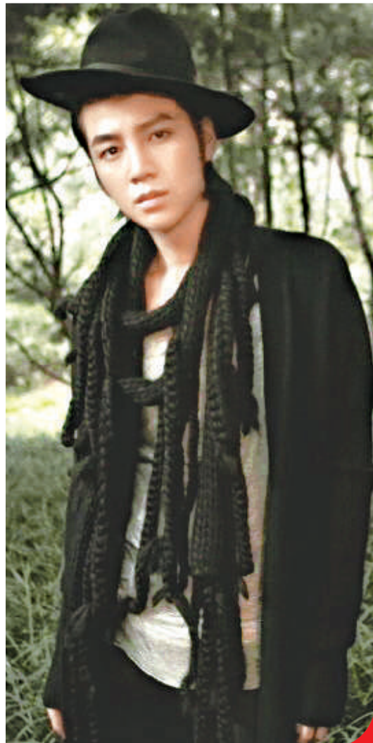
▲具慧善把拍攝現場的實況放上其個人網頁，網友送上鼓勵