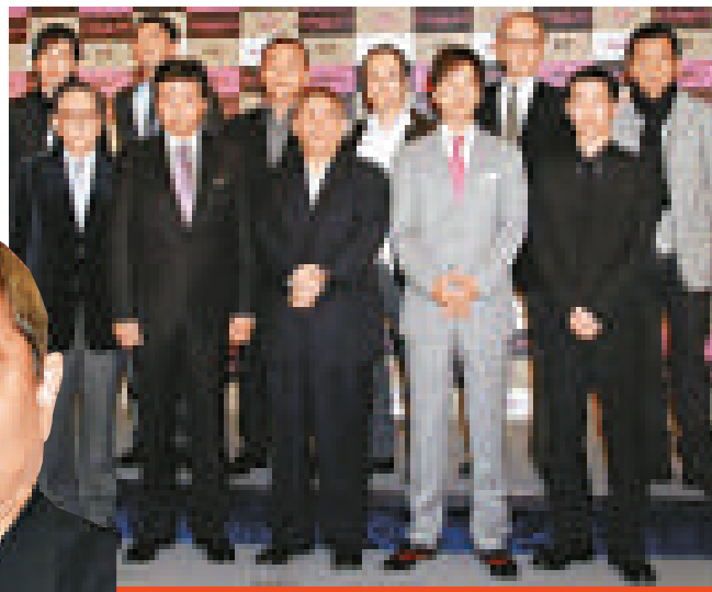
▲《Outrage》起用全男班演員，氣勢十足 ▲北野武強調新片的笑點就是暴力場面