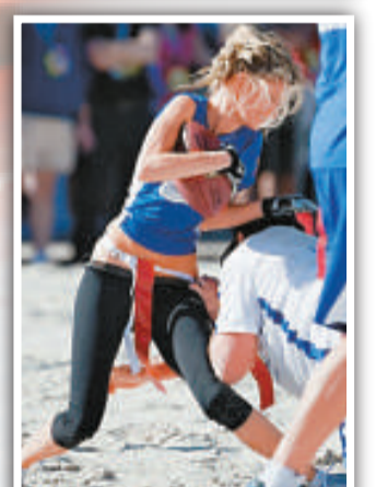
▲「維多利亞的秘密」內衣名模瑪麗莎米勒在沙灘超級碗中慘被剝褲