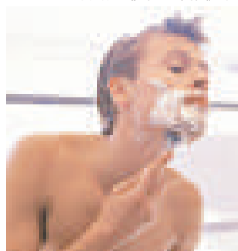
▲研究指出，男人花在打扮的時間竟然比女人還長 (互聯網)

三分之一的男人表示，他們覺得男人在這方面花時間跟女人一樣多，並不值得大驚小怪。委託這次調查的化妝品連鎖店 Superdrug 發言人西蒙·科明斯說：「當今，男人保持美觀的外表，散發良好的香味，會得到大家的欣賞。」（英國《每日郵報》）