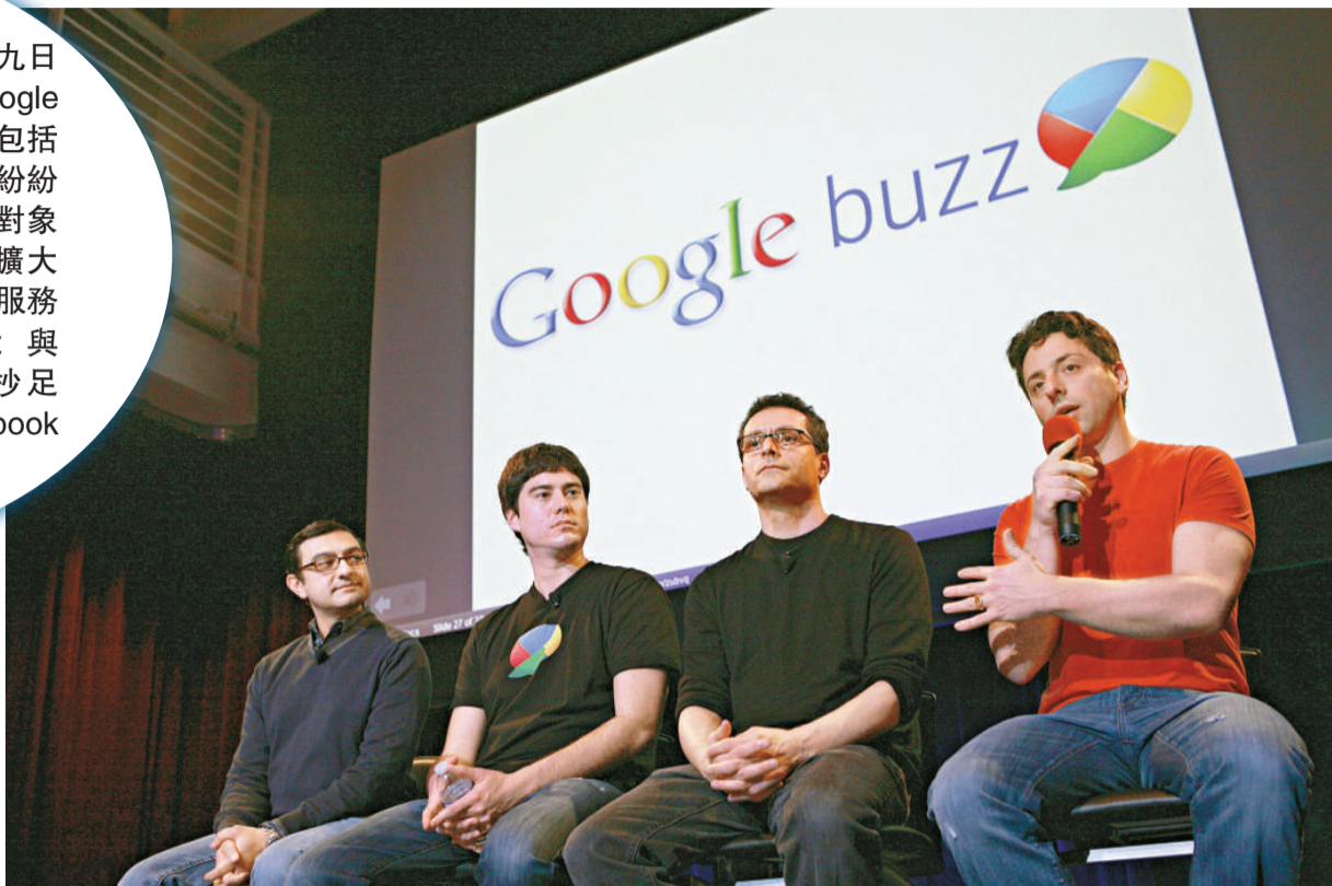
▲谷歌創辦人之一謝爾蓋·布林（右）九日宣布推出谷歌版本的社交網站 Buzz

【本報訊】據美聯社三藩市九日消息：互聯網搜尋器谷歌（Google）最近四出「挑釁」業內對手，包括微軟、蘋果、亞馬遜在內的巨擘紛紛成為了 Google 企圖超越的競爭對象。昨天，Google 又把它的地盤擴大了，它九日推出了一項社交網站服務「Google Buzz」，功能與 Facebook 十分相似，介面也抄足 Facebook，顯然是要向 Facebook 下戰書。