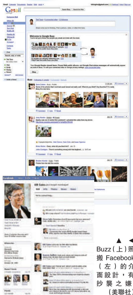
▲ Buzz (上) 照搬 Facebook (左) 的介面設計，有抄襲之嫌

今次 Google Buzz 的推出，看似只是 Google 和 Facebook 之間的角力，不過，「第三者」微軟卻「不甘寂寞」，立即對谷歌提出批評，指 Google Buzz 只是「又一款社交網站」。微軟還表示，Hotmail 早在二〇〇八年就已經推出了類似的服務了。微軟在聲明中說：「忙碌的用戶不需要又一個社交網絡。我們一早已這麼做了。Hotmail 用戶早已享受到微軟帶來的便利，我們二〇〇八年便已整合了 Flickr、Facebook、Twitter 和其他七十五家合作夥伴的服務。」