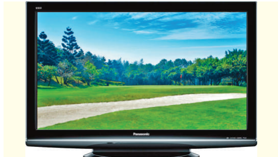
▲ Panasonic 50吋全高清Plasma iDTV (TH-P50S10H)

中原客戶服務熱線：2349 9111 查詢詳情，請致電中銀信用卡24小時推廣熱線2108 3288或瀏覽www.boci.com.hk。