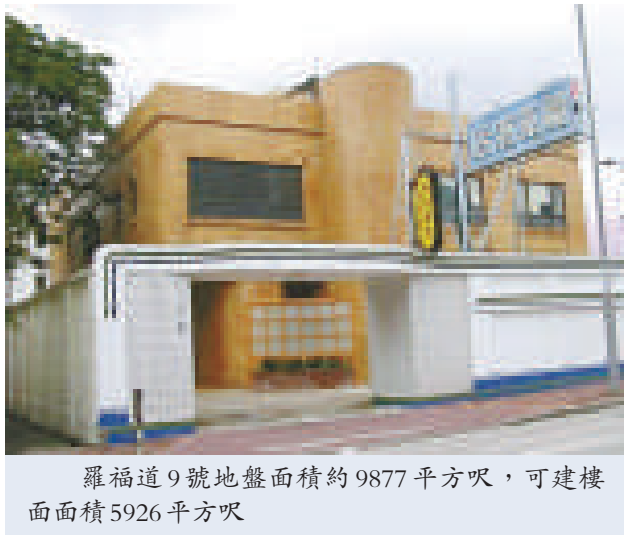
羅福道9號地盤面積約9877平方呎，可建樓面面積5926平方呎

據悉，元昌置業早於1985年中以610萬元購入上述地皮，是次轉售帳面大幅獲利1.299億元，升值21.3倍。余彭年堪稱九龍塘地主，在區內持有另10多萬平方呎地皮，其中1幅罕有的3相連地，為根德道3至7號，面積龐大佔地4.5萬呎，正向政府申請增加樓面至9萬呎，計劃作酒店用途，倘申請獲批，有關酒店全部收益將永久用公益慈善事業，如未能成功批准，則再作其他安排。