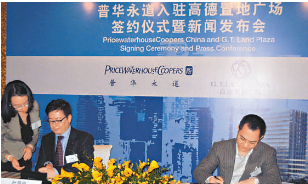
普華永道承租高德置地廣場簽約儀式