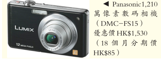
◀ Panasonic L1210 萬像素數碼相機 (DMC-FS15) 優惠價HK$1,530（18個月分期價HK$85）