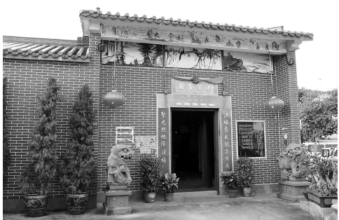
梅窩洪聖廟，是區內主要的廟宇之一