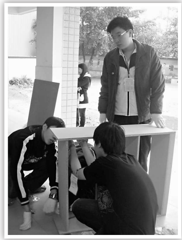
▲全神貫注做到最好

香港堪稱「彈丸之地」，寸土寸金，大型工廠及供青少年接受國民教育的場所較稀缺。隨着三三四新學制在全港鋪開，各校注重「其他學習經歷」，讓學生在傳統學科以外，擁有其他經驗達致全人發展。「條條大路通羅馬」，積累「其他學習經歷」方式多樣，可以做義工，深入社區，幫助有需之士，也可以下到企業實習學習。不過，在特首日益強調加強國民教育，提升國民身份認同之時，跳出香港小圈子，踏上祖國錦繡山河的尋訪之路，對身處新舊學制轉折點的一幫中四生也許更易實現「一箭雙鵰」之效。