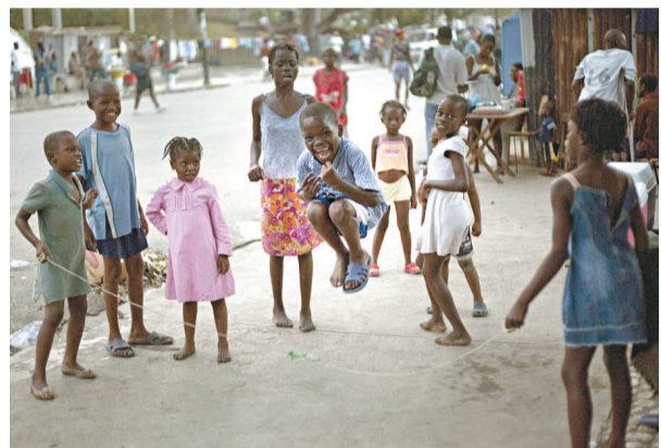
海地太子港的難民兒童苦中作樂

有消息指，歐盟外長森姆艾殊頓表示，歐盟一個軍方代表團將在今年三月雨季開始之前，為海地人提供避難場所。不過，森姆艾殊頓的發言人質疑此消息，稱要完成建造避難場所的任務，至少需要十五天，而屆時雨季已經開始。據聯合國人道主義事務協調辦公室估計，約有二十七萬海地人將接受緊急建築材料的援助，以建造他們自己的臨時住所。