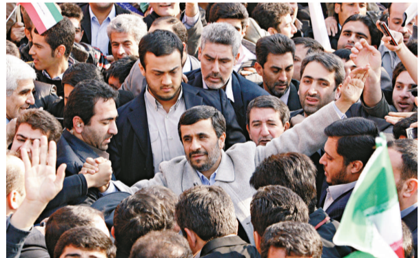
伊朗總統內賈德 (中) 在伊斯蘭革命紀念日上與支持者握手

本月七日，艾哈邁迪內賈德表示，如果有關國家不能就核燃料交易問題達成協定，那麼伊朗將自行生產純度為百分之二十的濃縮鈾。