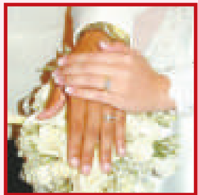
英國的結婚人數創下了近一百五十年的新低 (資料圖片)

英國保守黨指責執政的工黨在鼓勵民眾結婚、宣傳家庭觀念方面乏善可陳，倡導應該以減稅政策鼓勵結婚。但工黨認為，政府應該保障所有同居情侶的權益，無論他們是否結婚。