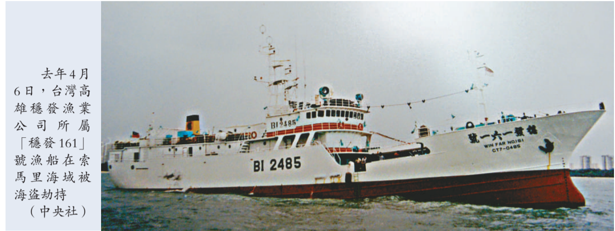
去年4月6日，台灣高雄穩發漁業公司所屬「穩發161」號漁船在索馬里海域被海盜劫持

台「外交部」並說，在確悉「穩發161」號將獲釋放前，「外交部」協助船東正式聯繫國際反海盜機制，請求提供適當保護及人道援助作業。上述機制經國際協調鄰近海域軍艦在「穩發161」號獲釋駛出外海後進行補給食物、飲用水、燃油及對遭劫持10個月來的船員進行健康檢查等例行人道援助作業。