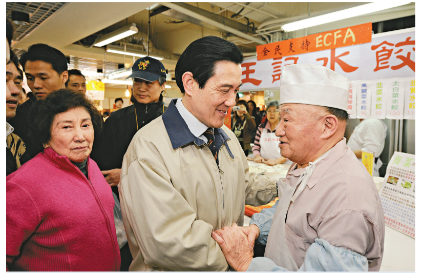
馬英九（前中）昨日陪同母親泰厚修（前左）一同到住家附近的興隆市場採買年菜。店家向他展示寫著「全民支持ECFA」的春聯，馬英九樂開懷

遠見分析，在新流感疫苗負面效應暫告平息，執政團隊對健保費調漲、便利商店代收汽車燃料費的手續費調漲、中油公司向民眾超收空氣污染防制費等民生議題外，馬英九也首次針對兩岸經濟協議（ECFA）向媒體說明政策考量，並宣布定期舉行記者會說明協商進度