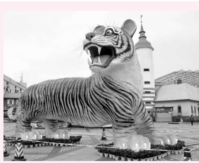
最大仿真老虎 12日，一隻高10米、長15米的巨型「瑞虎」昂首挺胸地矗立在長沙世界之窗公園主廣場上。這隻老虎斥資20萬元製作，用實心泡沫造型，進行細緻的雕塑和黏合後，再用彩色玻璃鋼對其表面進行上色和神情描繪。

貝聿銘在其建築設計生涯中，曾設計了華盛頓國家藝術館、波士頓肯尼迪藝術館、巴黎盧浮宮擴建工程、香港中銀大廈等眾多經典建築，當記者問他最喜歡自己哪件作品時，他說，這個很難說，「都是自己的女兒，你說哪個會更喜歡？」