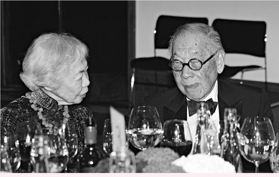
▼貝聿銘和夫人一起參加頒獎典禮

【本報訊】被譽為「現代建築的最後大師」的美籍華人設計師貝聿銘，11日晚在倫敦獲頒2009年英國皇家建築師協會金獎，這是其繼1983年獲得建築界奧斯卡獎——普利茲克建築獎之後，又一次獲得世界建築設計頂級大獎。但是，在談到中國當代建築設計時，貝聿銘就大彈「很多建築缺少中國自己的文化味道」，又直指北京拆老城牆是錯誤的，「北京城裡最好不要有新建築」。