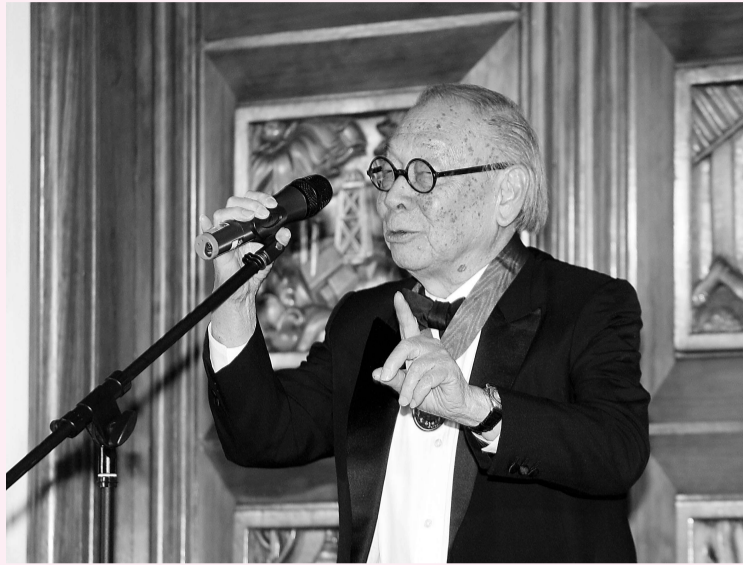
▲93歲的貝聿銘在倫敦獲頒英國皇家建築師協會金獎