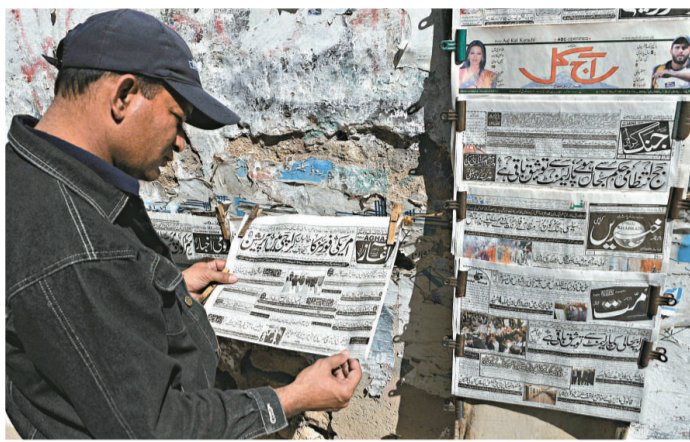
▲一名阿富汗男子在閱讀塔利班軍事指揮官被捕的新聞

北約和阿富汗聯合部隊本月十三日發起的這次軍事進攻是二〇〇一年美國發動阿富汗戰爭以來，針對塔利班發動的最大規模軍事清剿行動。據北約領導的駐阿富汗國際安全援助部隊十三日發布的公告，大約一點五萬名美國海軍陸戰隊、北約駐阿國際安全援助部隊和阿富汗國民軍軍人投入了這場戰役，戰役的主要目標是佔領據信為塔利班重要據點的馬爾賈城。