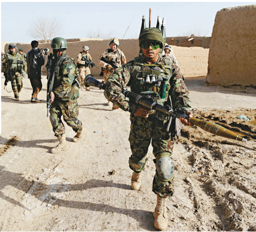
▶參與「共同行動」的北約聯軍在赫爾曼德省巡邏