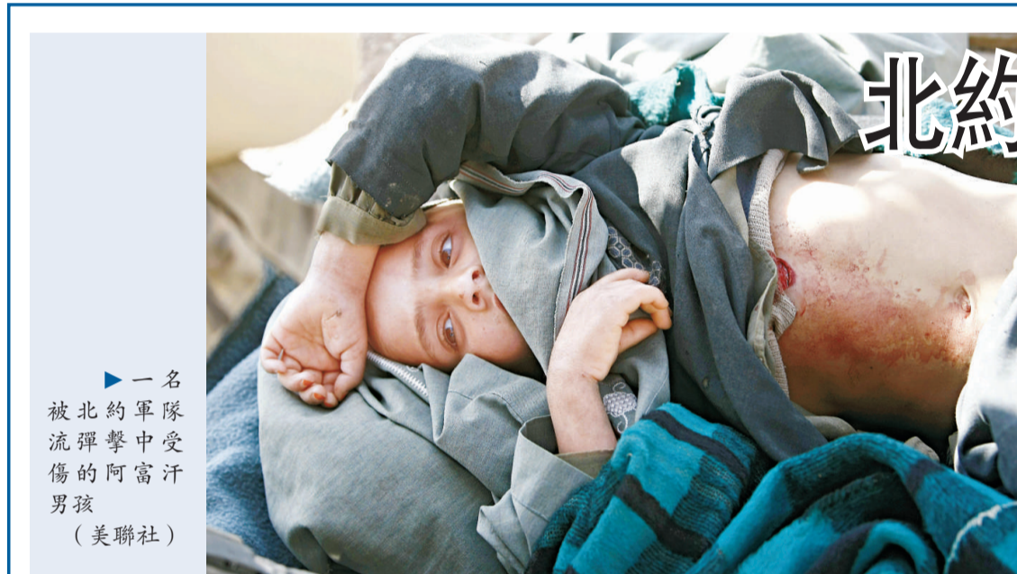
▶一名被北約軍隊流彈擊中受傷的阿富汗男孩