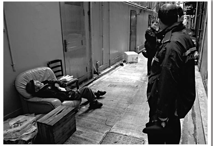
▲斜臥沙發的老翁在警員趕抵現場時已無反應