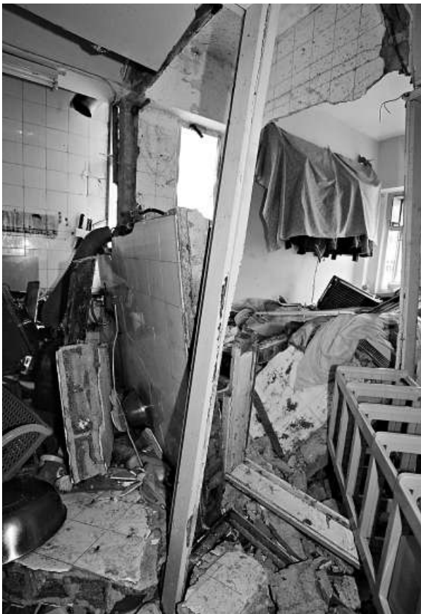
▲發生熱水爐爆炸的單位（本報攝） ▲肇事單位的窗門（紅箭咀所示）幾近飛脫（本報攝）

有水電師傅指出，電熱水爐若恒溫掣失效，當爐內水蒸氣壓力過大，便會發生爆炸。市民若發現電熱水爐運作有異常，應立即關掉電源，從速安排維修。