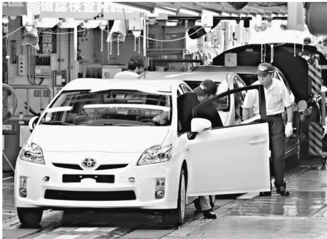
豐田回收事件將大大打擊日本製造業，令原本受日圓上升困擾的日本出口業雪上加霜