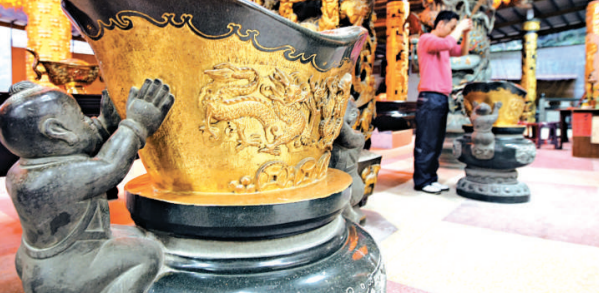
台灣部分民眾選擇在農曆新年，前往台北縣石碇五路財神廟祭拜，祈求新的一年能受到財神爺的眷顧（中央社）

廟方表示，除夕至今，人潮不斷，平均每天發出1萬個以上的小紅包，大家都希望財神爺保佑，財源滾滾來。廟方代表劉先生指出，今年和往年比，排隊人潮更多，但讓廟方欣慰的是，不只是求財，很多民眾是來還願的，代表景氣回暖，民眾日子好過了些。