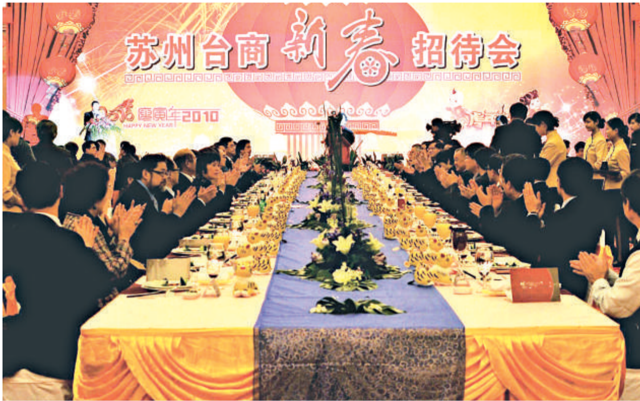
今年蘇州不少台商都留在當地過年，圖為蘇州市政府在本月初舉行「台商新春招待會」（資料圖片）

許多在大陸投資的台商以大陸為家，呼朋喚友在大陸過年已成為他們的過年方式。蘇州是大陸吸引台資最為活