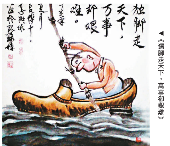
▲《獨腳走天下，萬事卻艱難》