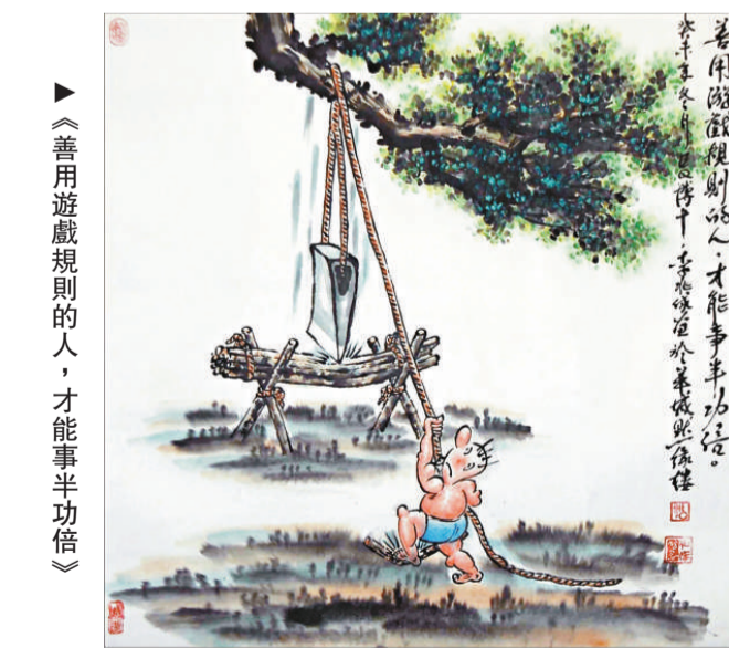
▲《善用遊戲規則的人，才能事半功倍》