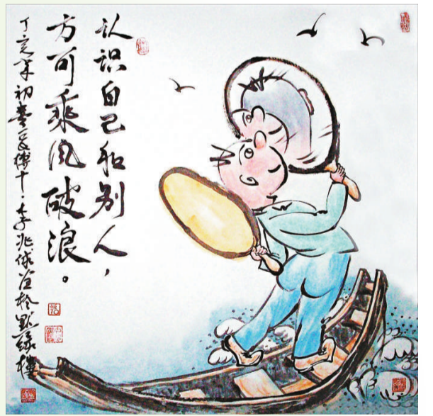
▲《認識自己和別人，方可乘風破浪》

自己比較滿意的作品之一。所謂「遊戲規則」，即事物發展的規律，懂得並掌握事物發展的規律，就能事事順暢，反之就處處碰壁。作者通過借喻的方式，簡單的一條長繩、一把斧頭，一下子砍斷許多條樹木，就將一個人能力有限，必須掌握規則才能將事情辦好的道理表達出來。