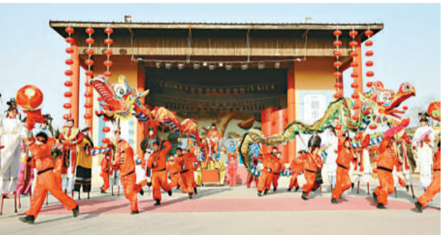
清明上河園舞龍表演賀新春