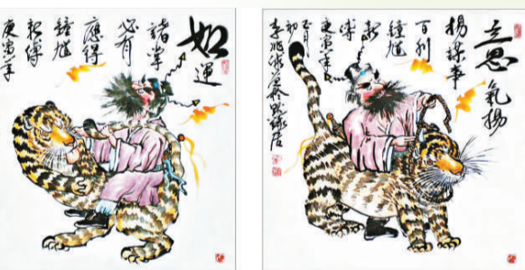
▲《如意吉祥——鍾馗新傳慶虎年水墨漫畫》

「虎舞南海——李兆球水墨哲理漫畫展」正在廣州市黃埔區南海神廟舉行，展期至二月二十八日（農曆正月十五元宵節），近二百件著名哲理漫畫家李兆球近年的力作幽默風趣、寓教於樂，讓觀眾從中領略人生哲理，啟迪思維。