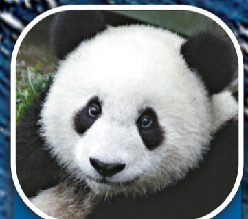
大熊貓 地區 中國四川 總數量 約1600隻