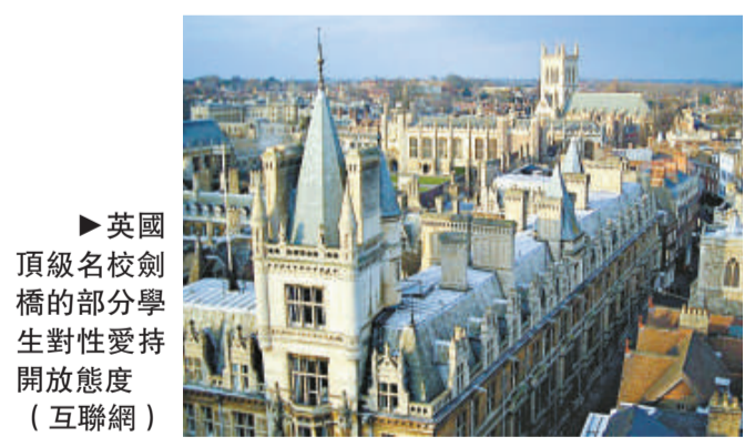
▶英國頂級名校劍橋的部分學生對性愛持開放態度

她說：「如有機會的話，我願意和一名有吸引力的男士性交。事實上，我身邊有大量這種機會。」(英國《每日電訊報》)