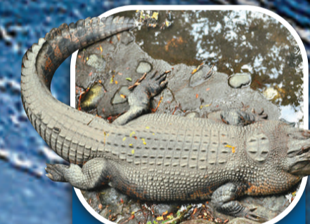
菲律賓鱷 地區 菲律賓 總數量 約100隻