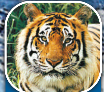
老虎 地區 亞洲 總數量 3200隻