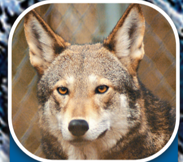
紅狼 地區 美國 總數量 約300隻