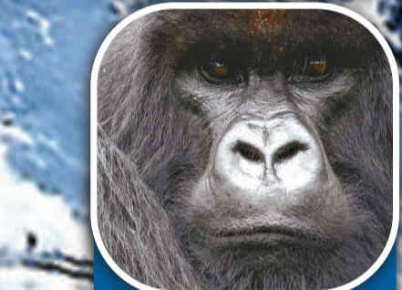
山地大猩猩 地區 中西非 總數量 約700隻