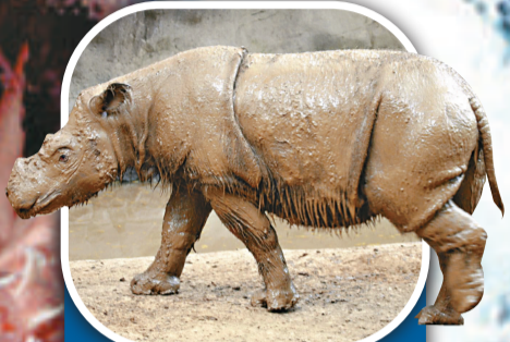
蘇門答臘犀牛 地區 南亞、東南亞 總數量 約300隻