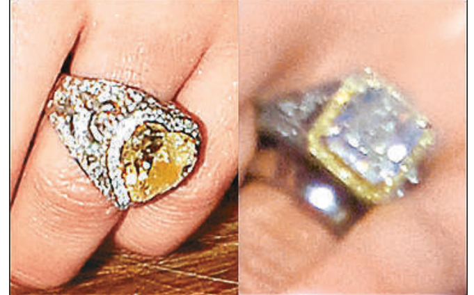
▲Cheryl Cole 兩隻價值不菲的鑽戒成為歹徒的下手目標

其中一張影像展示了彗星「塞丁泉」。這顆彗星在太陽周圍近距離移動時所散發的塵埃，在紅外線中綻放光芒，連進行觀測任務的那座太空望遠鏡都看到了。(美國 Space.com 網站)