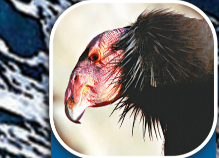
加利福尼亞禿鷹 地區 美國西部 總數量 約348隻