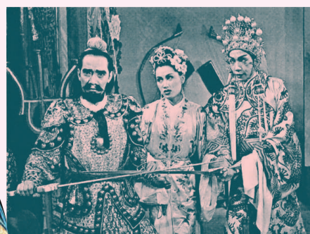
《人海萬花筒》由十個故事串連