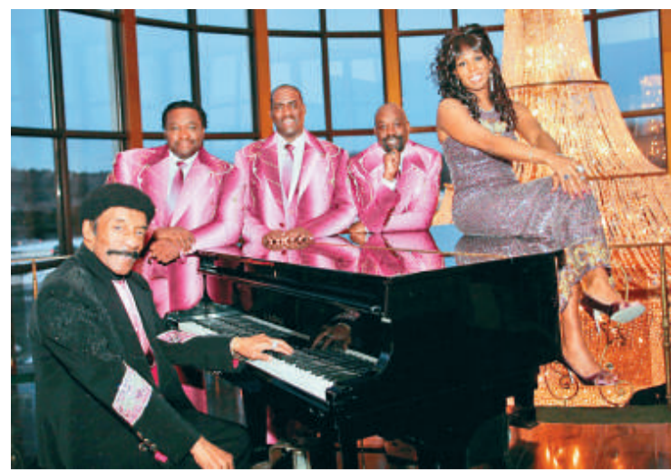
▲Herb Reed 與 The Platters

【本報訊】著名黑人合唱團 The Platters 將於三月來港演唱一場，獻唱全部家傳戶曉的名曲，如《Only You》、《Smoke Gets In Your Eyes》、《The Great Pretender》、《My Prayer》、《Twilight Time》等。