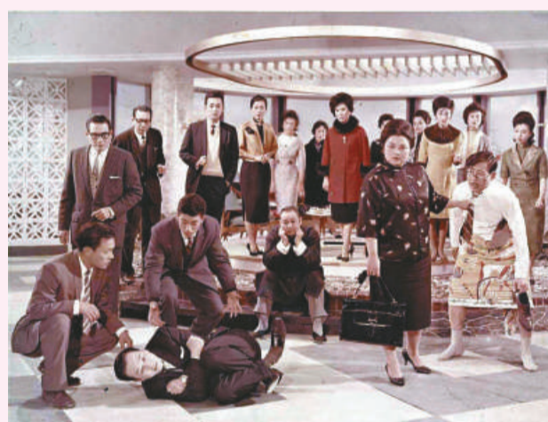
《豪門夜宴》以盛宴反映各階層人物心態