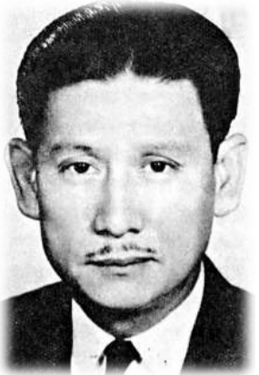
香港早年的名導演李鐵