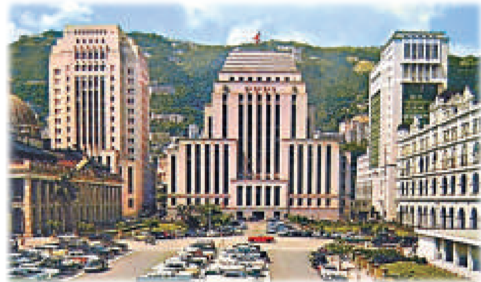
上世紀六十年代的滙豐銀行

還有一款褲頭帶，分布製及皮製的，在運送小量鈔票、黃金時，可將黃金或錢鈔以褲頭帶纏在腰間，以保安全。外資銀行高層均是外籍人士，要和低層職員溝通便要聘請懂得外語的華人當經理。這