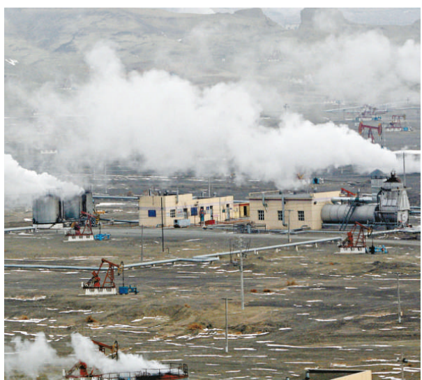
春節期間，新疆克瑪依油田的萬名石油工人放棄與家人團聚，工作在茫茫戈壁，在生產一線度過新春佳節。圖為克瑪依油田九九區油田

根據中國《農村五保供養工作條例》，五保供養是農村的集體福利事業。五保供養對象是指「無法定撫養義務人、無勞動能力的、無生活來源的」老年人、殘疾人和未成年人。