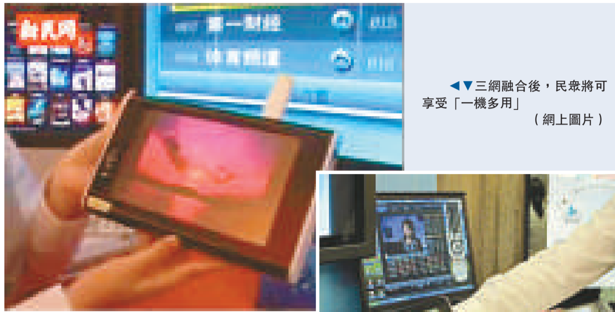
三網融合後，民眾將可享受「一機多用」

隨之而來，IPTV、手機電視、移動互聯網、VOIP 等新業務將迎來大發展，人們的生活工作將因此而改變。曾劍秋舉例，今後家裡兩台電視，一台用來看高清晰