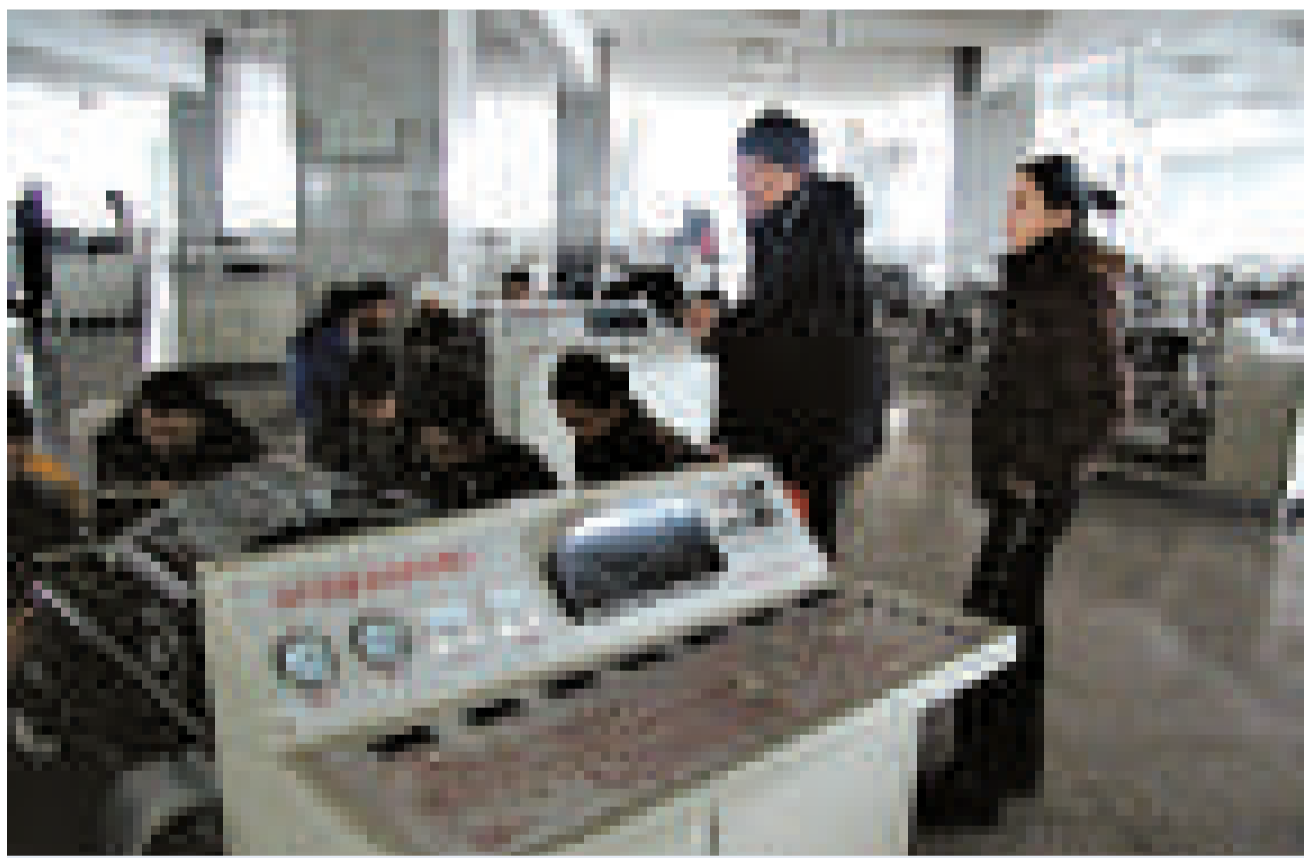
對於被指襲擊谷歌源頭，山東藍翔高級技工學校作出否認。圖為藍翔高級技工學校學生在實習

【本報訊】據新華社二十日報道：谷歌(Google)等數十家美國企業的電腦上月遭受黑客襲擊，日前有報道指襲擊源頭可能是上海的交通大學和山東的藍翔高級技工學校，不過，藍翔技校二十日否認這一說法，聲稱內部調查並沒發現相關跡象。