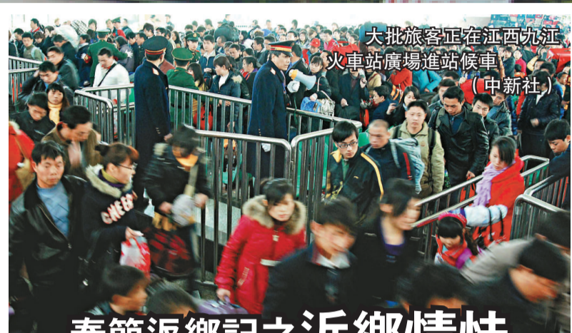
大批旅客正在西九龍火車站廣場進站候車。