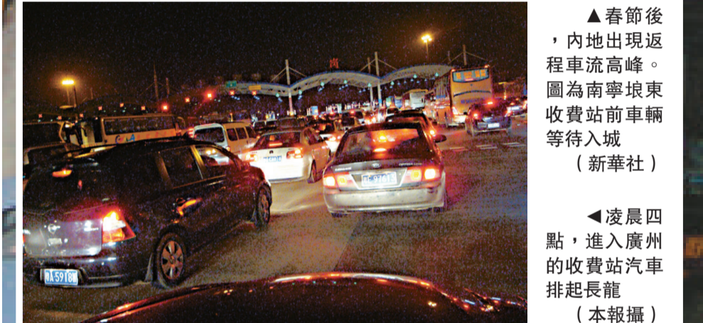
▲春節後，內地出現返程車流高峰。圖為南寧東收費站前車輛等待入城。 ▲凌晨四點，進入廣州的收費站汽車排起長龍。