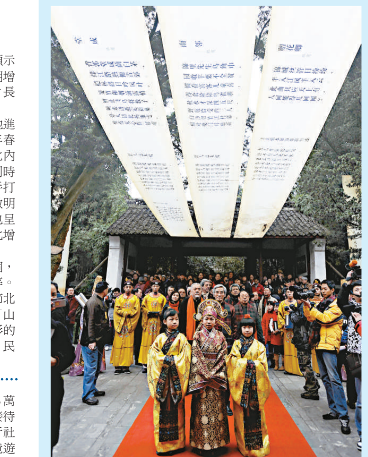
「人日」祭杜甫 20日，成都杜甫草堂舉行「人日」祭拜聖杜甫儀式。

【春節】期間，廈門市旅行社累計接待4200團5.5萬人次，增長1.1%，其中接待境外團170個3300人次，接待國內團4050個5.17萬人次，分別增長1.5%和1%；旅行社累計組團1200個1.6萬人次，增長3.2%，其中組織出境遊近4000人次，增長3%。節日期間，廈門出現導遊、旅遊用車、住房緊缺的情形。其中，2月16日、17日兩晚，廈門大部分的高星級旅遊飯店出現一房難求的情形；快捷酒店和鼓浪嶼家庭旅館更是連續幾天都爆滿。