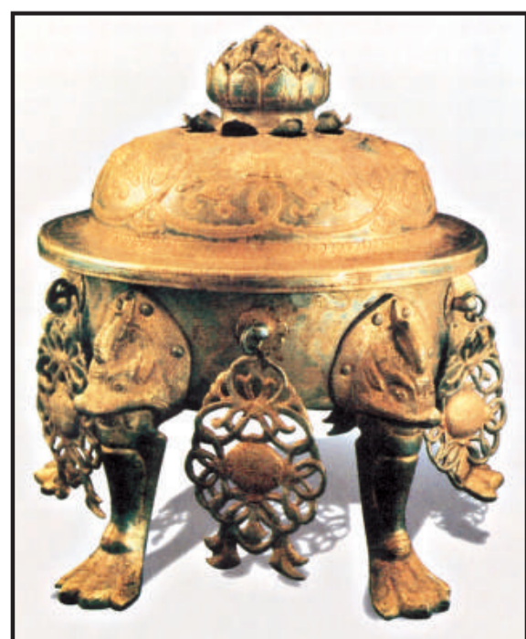
唐鑲金臥龜蓮花紋采五足銀熏爐