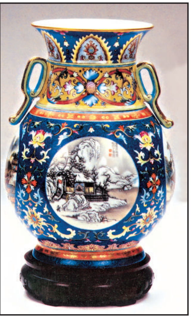
粉彩開光山水轉頭瓶