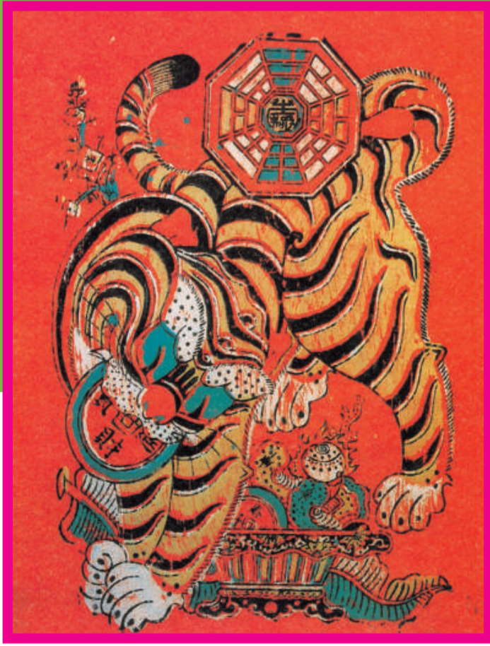
《鎮虎圖》清中葉 福建泉州