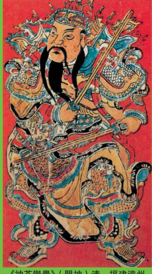
《神茶鬱墨》(門神)清 福建漳州

閩南的泉州港—漳州月港—廈門港的海交文化路線，客觀上促進了閩南經濟的繁榮，也促進了包括木版年畫在內的民間工藝的發展，大量的木版年畫由這裡遠銷台灣省和東南亞等地區。 作為民間繪畫藝術，閩台木版年畫都有着共同的特點，那就是它們所表現的內容和形式都非常豐富，把木版年畫作為表現「誠、善、美」等倫理意識的載體。以泉、漳木版年畫為例：眾所周知，泉州是對外航運的大港口，是我國著名的文化古城，民俗活動相當豐富，據《閩書》記載：「泉中上元後數日，大賽神像，裝扮故事，盛飾珠寶，鐘鼓震鳴，一同若狂」，足見當時民俗活動的熱鬧景象。故其以門畫符籙畫為主的木版年畫，就十分注重表現具有文化內涵的各種民俗活動。漳州年畫在清代形成興旺局面，以顏氏家族為代表的漳州木版年畫，清末時已有150多種畫樣。綜觀閩南木版年畫，題材內容大致可分為幾個方面：一是表現避邪消災鎮宅類的門神（如秦叔寶和尉遲恭、鎮宅老虎、避邪獅頭銜劍等），以及表現招財進寶、福祿壽喜的福神型門神；二是取材於民間神話故事、地方戲曲、人物及愛情婚姻之類，如八仙過海、陳三五娘、梁山伯與祝英台、孟姜女、空城計、雙后奇緣等；三是反映當時現實生活和民俗風情的題材，如廟會圖、九流圖、走船圖等；四是用於過年過節張貼窗門的福祿壽喜、春牛圖、貼花燈的吉祥圖案、裝飾圖等；五是用於作法事用的冥曆用品及供祭祀或宗教活動的年畫，常見的有福壽平安、保生大帝等。若細細地觀察，我們還可以發現，在泉、漳木版年畫所表現的題材內容中，透出一種有趣的地域文化的審美習慣，即將閩南方言體現在年畫上，形成寓意諧音的審美特徵。如人們用了閩南方言中「虎」與「福」的諧音，在