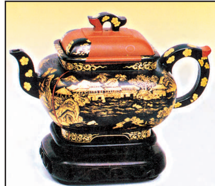
黑漆描金彩繪宮廷紫砂壺