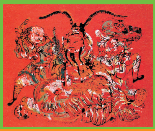
《八方進寶》清中葉 福建泉州