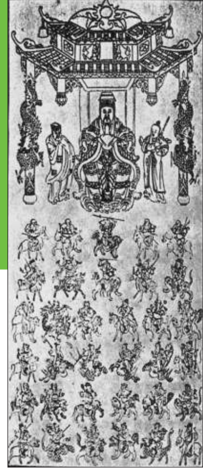
《保生大帝》清中葉 台灣台中