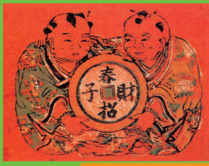
《春招財子》清中葉 福建泉州