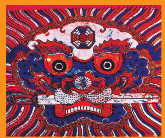
福建漳州獅頭銜劍