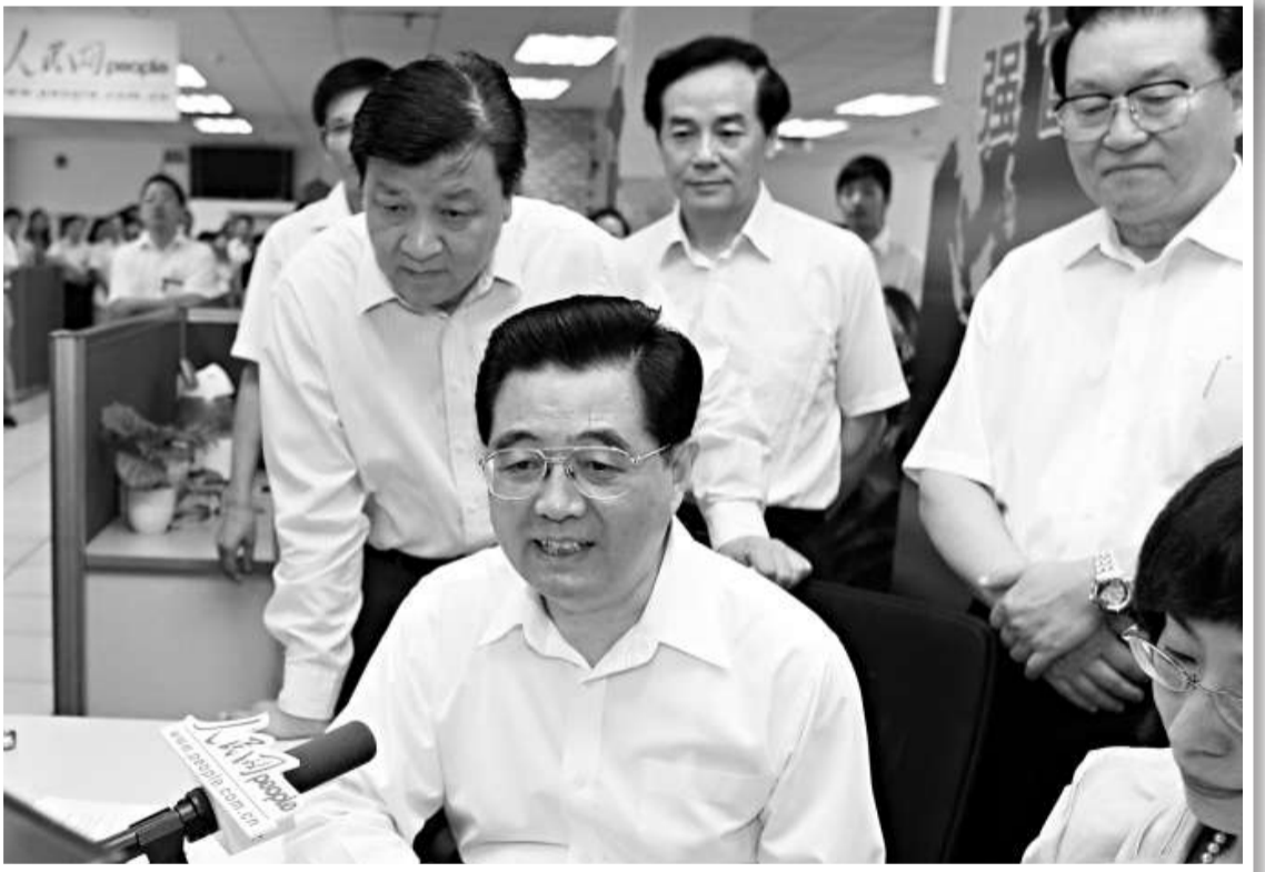
中共中央總書記、國家主席、中央軍委主席胡錦濤在2008年6月20日曾經作客人民網「強國論壇」

總的第一聲！」，期待胡錦濤盡快發布第一篇博客文章。也有不少「粉絲」已開始留言向胡錦濤反映蝸居、就業、教育等社會熱點問題。 雖然胡錦濤的微博粉絲早已躍居首位，但是目