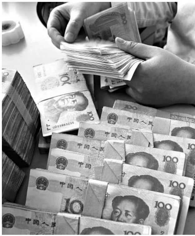
中共中央政治局22日召開會議。會議指出，今年要繼續實施適度寬鬆的貨幣政策 (資料圖片)