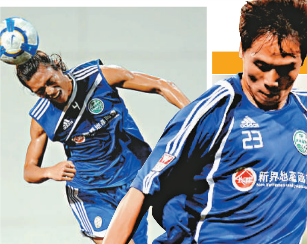
責任編輯：張志坤 美術編輯：符俊炫