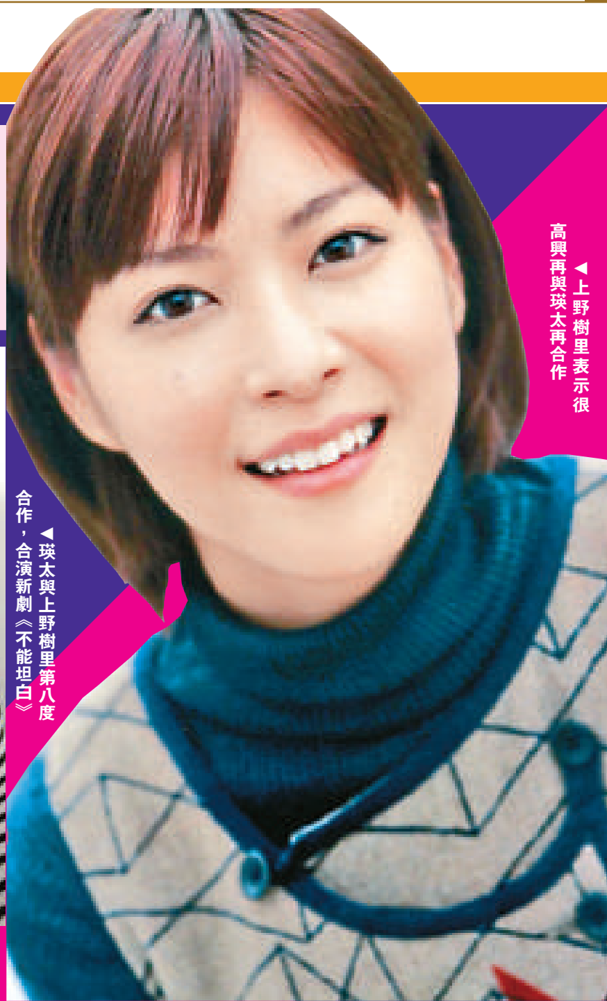
上野樹里表示很高興再與瑛太再合作