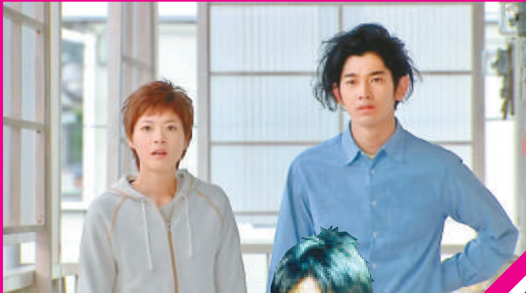
▲瑛太（右）和上野樹里前年合演的《Last Friends》收視極佳