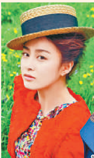
▲金泰希為時裝雜誌到新西蘭拍攝的造型照