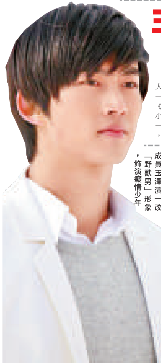
▲「2PM」成員玉澤演一改「野獸男」形象，飾演癡情少年