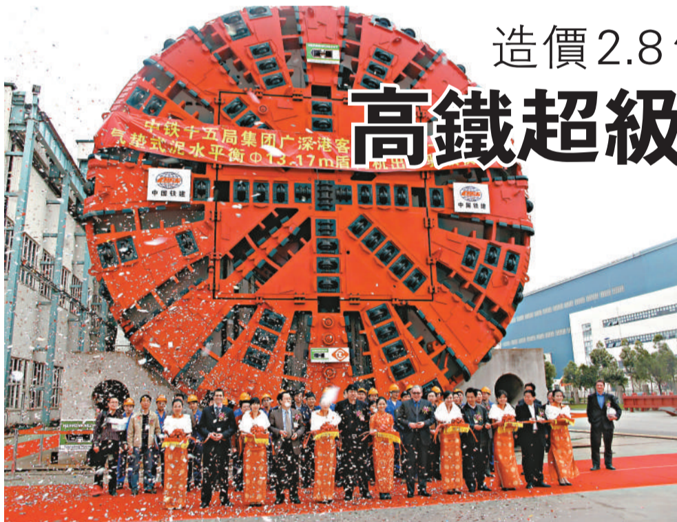
廣深港高速鐵路深圳段隧道挖掘盾構機昨天在南沙區的廣州海瑞克公司完成出廠驗收

【本報記者黃裕勇廣州二十四日電】繼香港立法會正式批准廣深港高速鐵路撥款後，該條跨越粵港兩地的大型基建項目正加速推進。今天，將用於廣深港高速鐵路深圳段隧道施工的大型盾構機，在位於廣州南沙的廣州海瑞克隧道機械有限公司正式出廠驗收。該機將在三個月後正式在深圳段投入隧道施工使用。據悉，這將是中國鐵路建設史上使用的最大直徑的盾構機器，預計深圳段盾構工程將於2012年貫通。