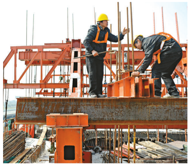
廣深港高速鐵路廣東段已展開工程

該次元旦遊行，反對派示威者在到達終點中聯辦，期間有部分人士不理會警方六次警告，走出沒有封路的行車線，推倒鐵馬，更與警員推撞衝突，試圖衝擊警方防線，並焚燒旗幟，事件導致三人受傷，當中包括兩名警員，西區交通癱瘓近三小時。西區警署分區指揮官陳進事後批評部分示威者，刻意挑釁及衝擊警方，違反警方與主辦單位的協議。