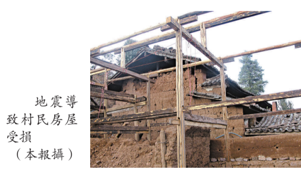
地震導致村民房屋受損

【本報記者劉林秋、保紅、劉寅楚雄二十五日電】2月25日12時56分，雲南省楚雄彝族自治州祿豐縣與元謀縣之間（北緯25.4°，東經101.9°）發生5.1級地震，震中位於祿豐縣高峰鄉與元謀縣羊街鄉交接附近，震源深度16km。昆明等地均有震感。楚雄州元謀、祿豐、