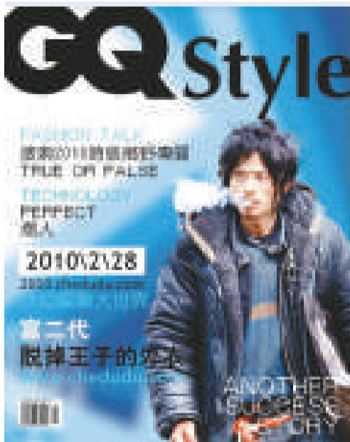
▲「犀利哥」網絡爆紅，網友把他放上潮流雜誌封面

【本報訊】「劉天王的鼻子和嘴，水島宏的眼睛和臉型，韓寒的不羈，梁朝偉的瀟灑，還有那蓬鬆的頭髮，不屑的眼神……」被網友譽為「究極華麗第一極品路人帥哥」的乞丐王子「犀利哥」最近紅透網路，雖然真身依然是個謎，但在網友和媒體的關注和搜索下，「犀利哥」的身世傳說在網絡上越傳越多，真假難辨，甚至有一位江蘇女士聲稱「犀利哥」是其失蹤丈夫，欲尋找其下落。