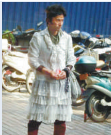
◀ 網友發圖指「犀利哥」喜歡穿女人衣服，透露其想要個家的渴望（互聯網）

【本報訊】「劉天王的鼻子和嘴，水島宏的眼睛和臉型，韓寒的不羈，梁朝偉的瀟灑，還有那蓬鬆的頭髮，不屑的眼神……」被網友譽為「究極華麗第一極品路人帥哥」的乞丐王子「犀利哥」最近紅透網路，雖然真身依然是個謎，但在網友和媒體的關注和搜索下，「犀利哥」的身世傳說在網絡上越傳越多，真假難辨，甚至有一位江蘇女士聲稱「犀利哥」是其失蹤丈夫，欲尋找其下落。