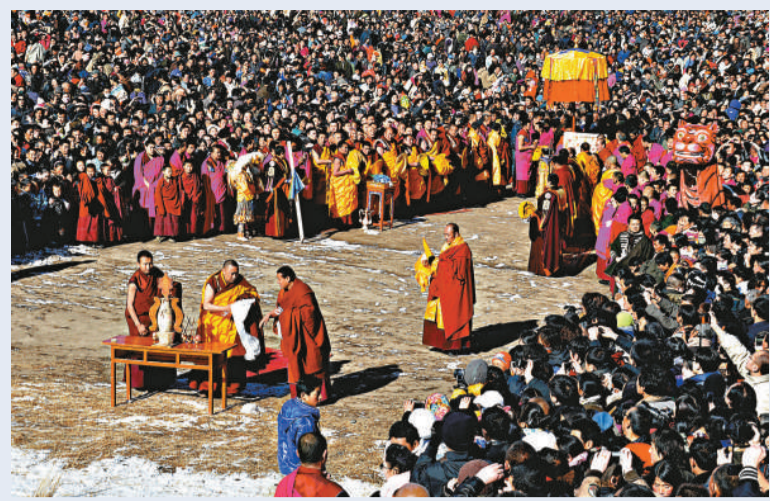
曬佛法會 26日，甘肅省甘南藏族自治州夏河縣拉卜楞寺舉行一年一度的曬佛法會，吸引了數千名藏族僧俗信眾前來參加。僧俗信眾和遊客跟隨曬佛法會隊伍，不斷用頭頂觸碰佛像，祈求好運。

對於「老饞貓」提供的一些數據，呂女士顯得有些失望，「身高不對哦，會不會是這些年到處流浪，人縮小了呢？」但她表示：「不管是不是他，總希望能找到他。」