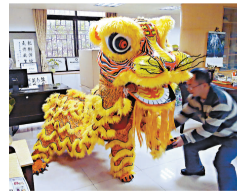
地處廣佛核心區的南海將在元宵打造一個民俗的歡樂世界。農曆虎年的到來，則讓南海獅王有了虎的元素，今年舞「獅」變新意，十八頭世界獅王將以「獅虎」造型為市民賀歲。