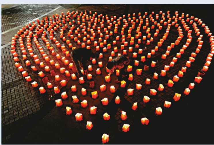
浪漫元宵 26日，長沙世界之窗公園用幾百盞紙燈在地上拼成心形圖案，迎接浪漫元宵