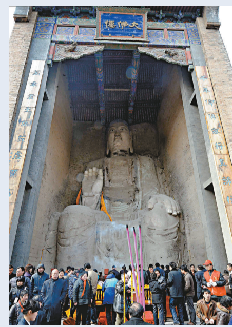
大伾山古廟會人頭湧湧

據介紹，浚縣正月古廟會已有上千年歷史，從每月正月初一到二月初二，為期長達一個月。廟會期間，吸引周邊20個省市以及海內外數百萬的香客、遊人觀光、祈福，日遊客量最高達100多萬人次，至今仍完整地保持着明清特色。