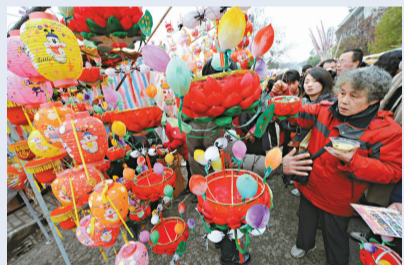
元宵節臨近，各地氣氛喜氣洋洋。南京夫子廟秦淮燈市市場生意興隆（上圖），烏魯木齊市喜樂社火鬧元宵（下圖）