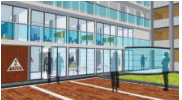
美荷樓活化為青年旅舍，香港青年旅舍協會建議地下外牆改為落地玻璃（模擬圖）

【本報訊】石硤尾美荷樓活化為青年旅舍的計劃，由於前身是公屋的大樓，每層走廊的結構狀況極差，香港青年旅舍協會建議重建走廊，並以玻璃圍封樓梯和走廊。美荷樓內的公屋博物館，提議命名為「美荷樓生活館」，展示昔日石硤尾生活，包括半世紀前發生的石硤尾大火。