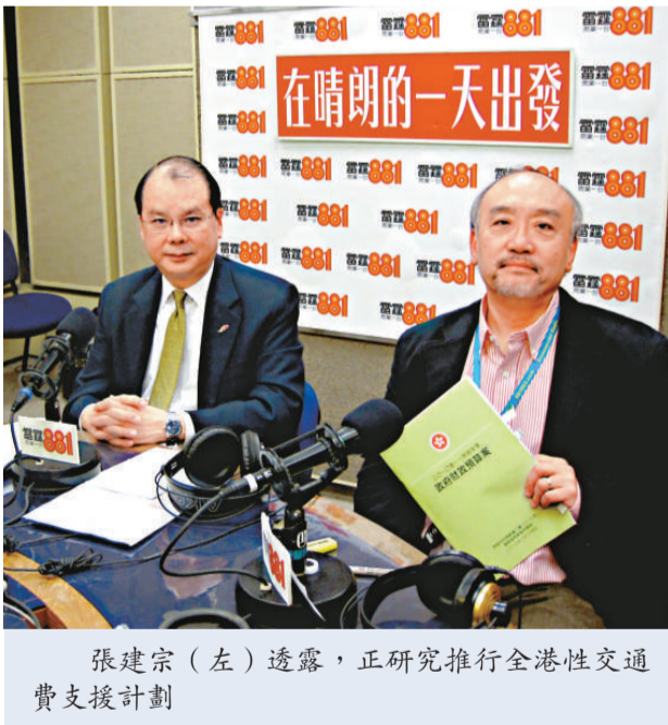
張建宗（左）透露，正研究推行全港性交通費支援計劃