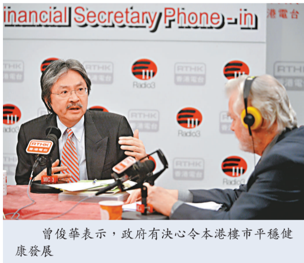
曾俊華表示，政府有決心令本港樓市平穩健康發展

【本報訊】財政司司長曾俊華表示，預算案提出的四項優化樓市措施，是為了給予市場清晰信息，政府有決心令樓市平穩發展。若然預算案提出的措施未能奏效，政府可能會再出新招。他說，未來會平衡經濟情況、樓市供求和炒賣情況，以及市民的負擔能力等因素，作出政策決定。而市建局未來兩三年內，將提供一千個中小型單位紓緩樓市。