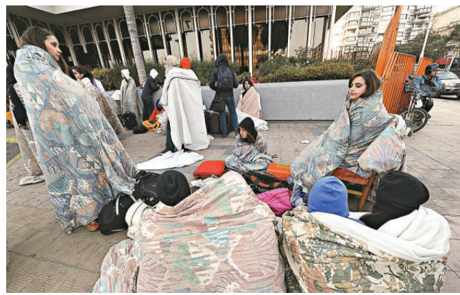
▲在比亞德爾馬市，遊客被迫露宿街頭

智利境內有2000座火山，數目僅次於印尼，而且是有「火環」之稱的太平洋地震帶的一部分。紀錄中已爆發的火山已有50至60座，潛在的活火山也有500座。全世界平均每年紀錄到的9000次地震中，有21%發生在智利。 1939年1月24日夜晚11時35分，智利沿海長達450英里的地區內發生了持續3分鐘的地震，強度達8.3級，受災最嚴重的是康塞普西翁、奇廉、科伊維克、科羅內爾和安文爾諸城。這次地震使50000人喪生，60000人受傷，70萬人無家可歸。 1960年5月22日，智利瓦爾迪維亞附近地區發生9.5級強震。此次地震不僅是智利歷史上規模最大的地震，也是世界上極為罕見的地震。此次強震引發了巨大海嘯，波及澳洲、新西蘭甚至菲律賓等國家，具體死亡人數難以有效統計，而經濟損失高達數億美元。這是世界上影響範圍最大、也是最嚴重的海嘯災難之一。 智利隨後在1965年、1971年、1985年、1987年、1995年、2005年和2007年分別遭遇7級以上強烈地震，其中以1985年3月3日發生在首都聖地亞哥附近里氏8級地震最為嚴重，共造成177人死亡，十多萬幢建築被毀。 另據歷史資料顯示，智利在1570年到1906年間共發生過7次8級以上地震，其中包括1868年發生的9級地震。(綜合外電)