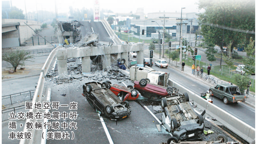
▲聖地亞哥一座立交橋在地震中坍塌，數輛行駛中汽車被毀

大傷亡。二〇〇四年十二月二十六日南亞大海嘯造成超過二十二萬人罹難，也讓亞洲國家對於海嘯的風險極為敏感。日本氣象廳表示，一九六〇年，有紀錄以來最強烈的規模九點五級地震侵襲智利，引發海嘯，在日本造成一百四十人死亡，在夏威夷奪走六十一條人命，菲律賓則有三十二人罹難。那次海嘯的波浪約為一至四米高。