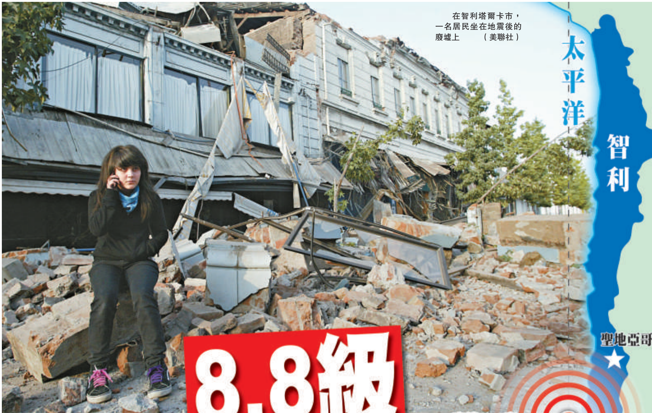
在智利塔爾卡市，一名居民坐在地震後的廢墟上