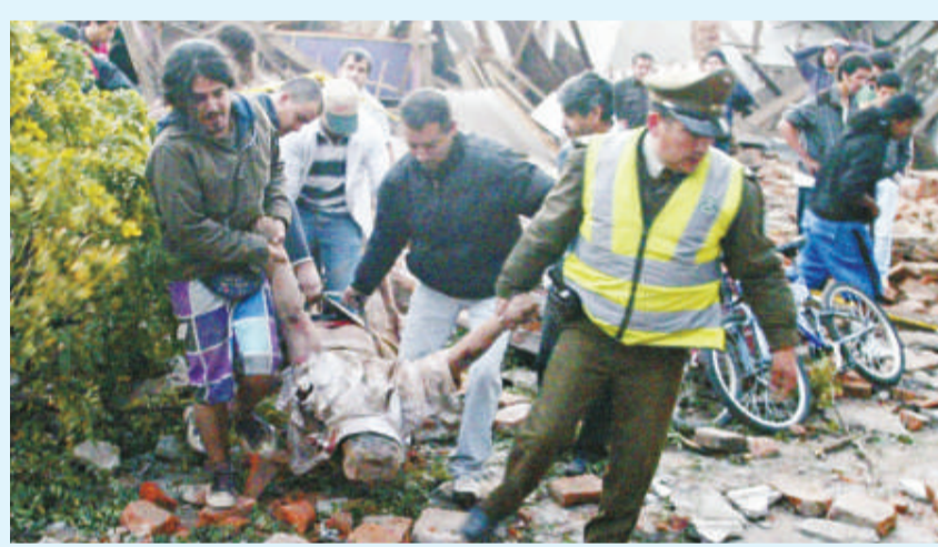
▲塔爾卡市救護人員抬走一名遇難者 ▼在智利第二大城市康塞普西翁，一幢建築物起火

巴切萊特又表示，數家醫院由於損毀而被迫疏散，全國第二大城市康塞普西翁與外界通訊中斷。