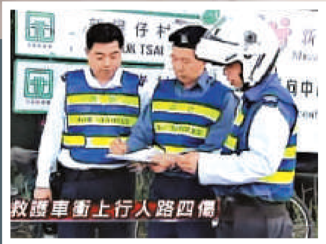
救護車衝上行人路四傷