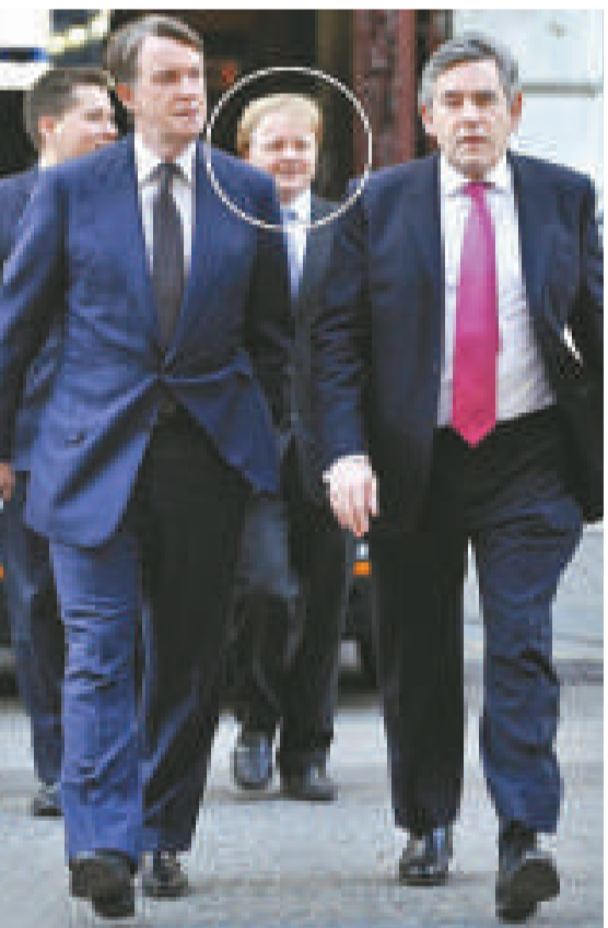
▲白高敦 (右) 以及他的助手施棟華、伍德 (小圈中)

【本報記者黃念斯倫敦二十八日電】為證實白高敦對下屬態度暴躁，白高敦的傳記記者公開採訪白高敦政治顧問的錄音，揭示白高敦脾氣暴躁，首相府員工及其助手忍受多年未敢聲張。令英揆「欺凌事件」更聲塵上。《星期日郵報》報導了女記者麥肯齊訪問白高敦助手施棟華、伍德的錄音內容：「有人指白高敦曾在首相府樓梯上對你暴跳如雷，出手打你，這是否屬實？」麥肯齊問。伍德回答：「那是件有趣的事……，但還不太算是出手打人吧。」但伍德證實白高敦當時確實曾對他咆哮：「給我滾開！」同時用一隻手將他推到一邊。「是的，我被嚇呆了。他沒有打我，只是將我推到一邊，我有點驚訝，站在那兒，想着，我的上帝，白高敦竟然能夠如此粗魯無禮。」伍德說。伍德還形容白高敦：「出色的財