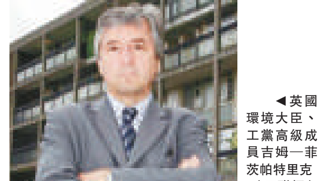
▲英國環境大臣、工黨高級成員吉姆·菲茨帕特里克

軍情五處同時將招募那些有街頭經驗、能夠滲透進入極端穆斯林組織的年輕穆斯林，以提前掌握這些極端組織的相關動向。但這項措施引起英國合法穆斯林團體和人士的不滿。英國穆斯林協會本月八日向倫敦老比利街法庭提出起訴，希望法庭能夠裁決軍情五處立即停止這種違反憲法的行為，還英國穆斯林人士一個公平、理性的生活空間。