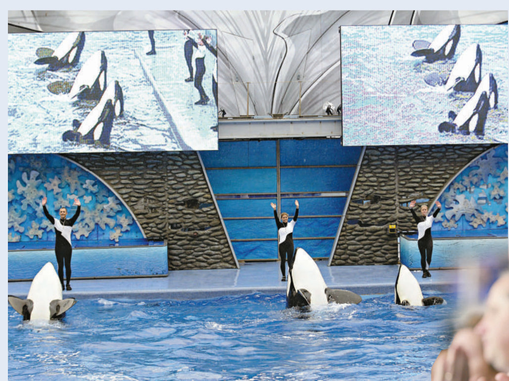
▲佛州海洋世界恢復殺人鯨表演 ▶訓練員參加布蘭喬的哀悼活動

【本報訊】綜合外電二十八日報導：日前發生殺人鯨殺死女訓練員慘劇的美國佛州海洋世界，周六恢復安排殺人鯨表演項目，吸引大批觀眾捧場，遊人都看得興高采烈，開懷大笑，那宗慘劇帶來的愁雲慘霧看來已經一掃而空。不過，今次有份參與表演的殺人鯨，並不包括日前鬧禍的「Tilikum」。表演正式開始時，一批訓練員集