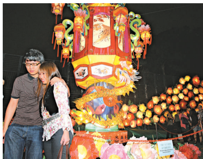
不少情侶趁元宵佳節出外慶祝

銅鑼灣時代廣場今年特別為情侶打造一條元宵街，在露天廣場設置了五個懷舊攤檔，包括龍鬚糖、手織草繩、糖蔥餅、家鄉蛋卷及掌相命理，吸引眾多市民和遊客欣賞及拍照留念。