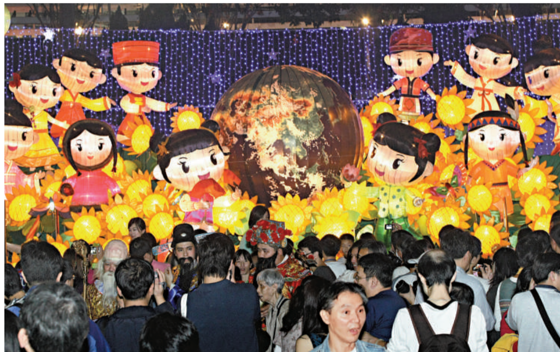
康文署昨日在本港不同地區舉行大型綵燈會，場面非常熱鬧

【本報訊】昨日是正月十五元宵佳節，亦是中國情人節，雖然天公不作美，天氣多雲有霧，不利市民賞月，但最少仍有八十五對新人選擇在元宵佳節共諧連理。康樂及文化事務署亦在不同地區舉辦多個大型綵燈會，讓市民在熱鬧氣氛中共慶佳節，其中高山道公園就展出多個造型栩栩如生的綵燈，賞燈者眾。為刺激人流，本港多個商場亦舉辦元宵節活動，氣氛熱鬧。