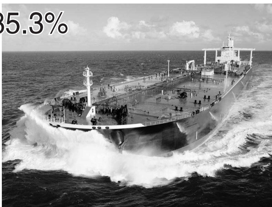
前線預期今年運油量將隨全球經濟好轉而回升

不過，該公司預期，基於全球經濟環境好轉帶動原油需求，今年油輪運量和運費均會回升。中東至日本線(TD3)費率已回升至35500美元，已較第三季回升18800美元，前線認為，今年首季平均費率可望進一步升至48100美元。